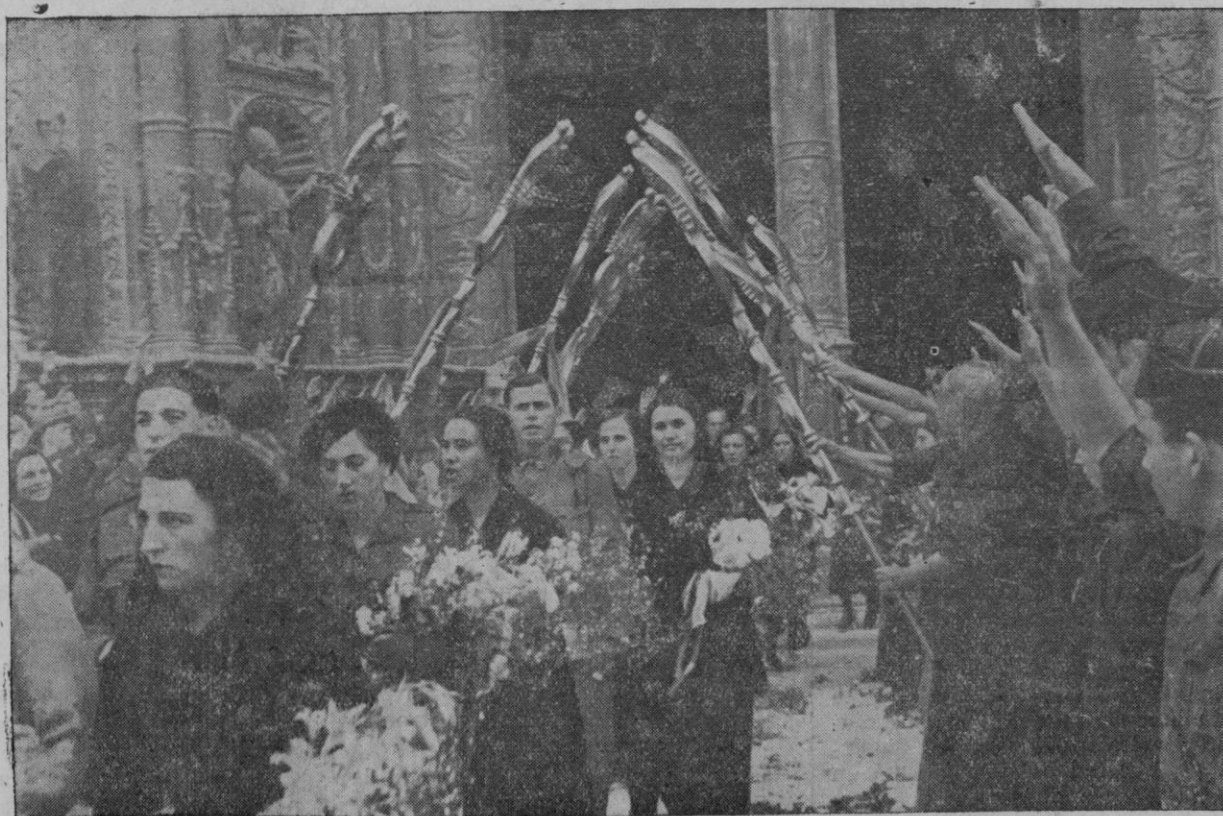
Las parejas de recién-casados al salir ayer de Nuestra Santa Iglesia Catedral Basílica después de la ceremonia nupcial