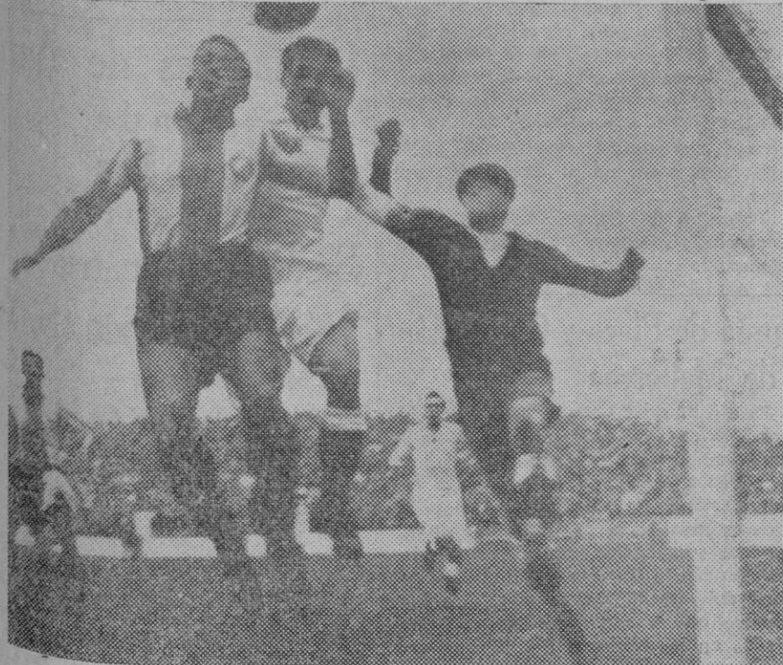
En el campo del Español, de Barcelona, lucharon el domingo el equipo titular y el Madrid ganando los catalanes por 3 a 0.