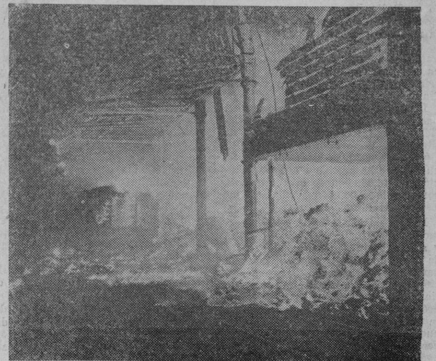
Estado en que quedó el depósito de la Compañía de Ferrocarriles de Dewsbury (Inglaterra) después del horroroso incendio que lo destruyó.

Decir que el paro forzoso es un producto de la industrialización, sería una vulgaridad imperdonable. Tanta vulga-