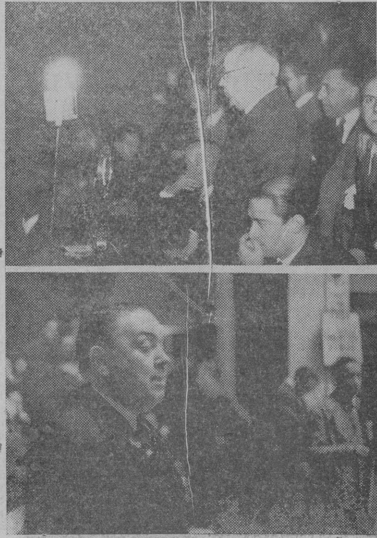
Arriba el Sr. Azaña y abajo el Sr. Martínez Barrio, en los actos de propaganda electoral de izquierdas celebrados el domingo en Madrid.

¿Porqué no prevenir esta necesidad, y al propio tiempo librar cuanto antes a la provincia de un hospital sin condición alguna buena?