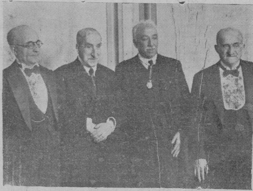
Don Salvador de Madariaga, en el acto de su ingreso en la Academia de Ciencias Morales y Políticas de Madrid, acompañado del Presidente de la República y de los señores Sánchez Toca y Conde de Romanones.

El propósito de los expresados señores es por demás loable y de gran interés para la provincia por lo que debería ser apoyado por todos los elementos de la provincia, a fin de lograr la subvención precisa para dar cima a las obras que se llevan a cabo.