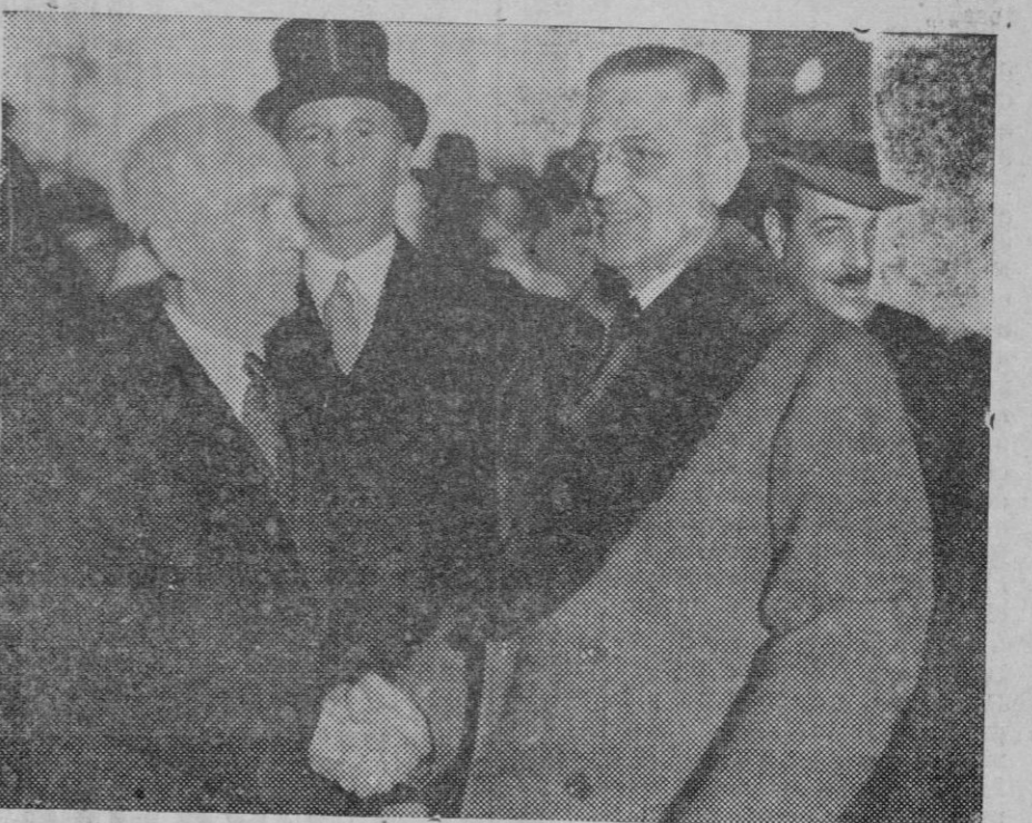
Llegada a Londres de la Delegación americana para participar en la Conferencia Naval, siendo recibida por el Embajador americano en la capital inglesa.