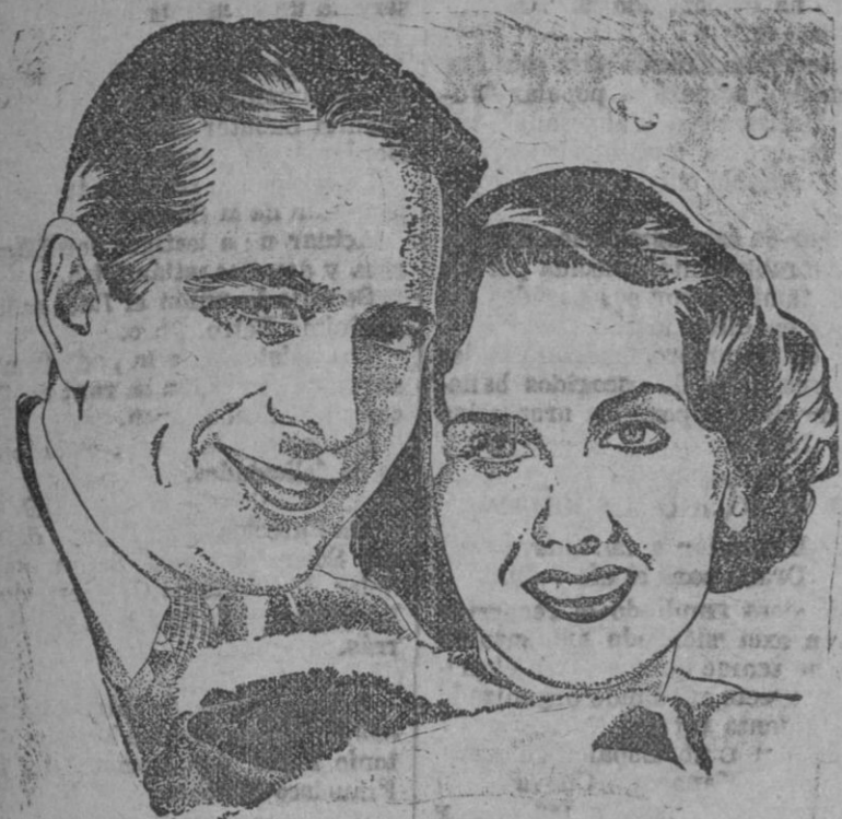
Donald Cook y Mary Brian en una escena de la producción Columbia-Cifesa «NEBLINA»