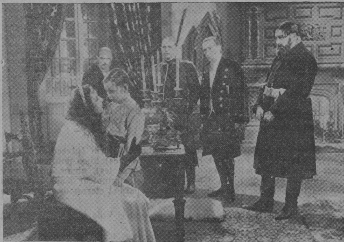
Una escena del emocionante film FEDORA que distribuye la entidad valenciana CIFESA en la actual temporada, y que se estrenó ayer con extraordinario éxito en el teatro Lírico

La arquitectura severa, de línea clásica y fábrica robusta está presentada con ese acierto que cautiva, interesa y atrae, a la vez que tiene un profundo valor evocador al hacer pensar en aquellos gloriosos días de grandeza his-