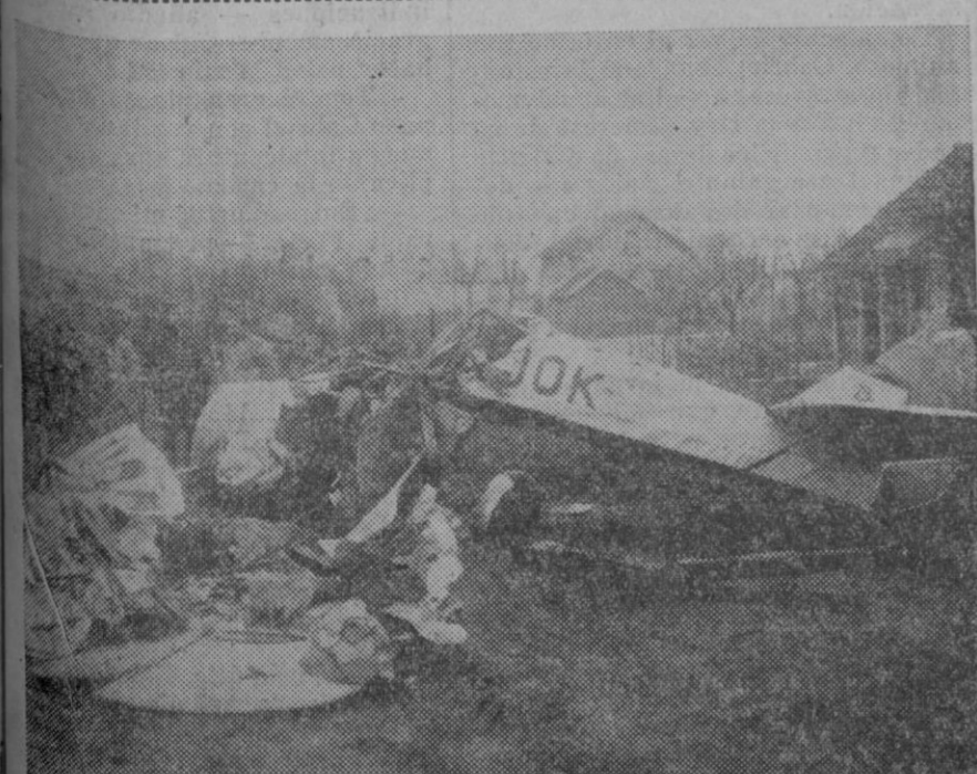
En Orly, Francia, ha ocurrido un grave accidente de aviación que ha causado la muerte a dos aviadores, Gactanida y Geurine.