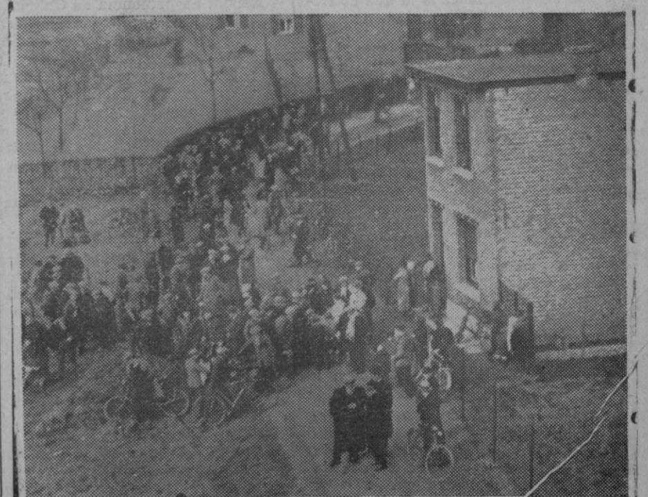
Un equipo de obreros que reparan la vía cerca de Málines, se vieron sorprendidos por el express Bruselas-Amberes. Siete obreros resultaron muertos y varios heridos, Express-Foto.

Di: en estas gentes, que el de más importancia práctica es el llamado "acero VM", que con proporción variable de carbono y 12 a 18 por ciento de cromo, puede templarse y es magnético. Esta clase de acero excepcional puede emplearse hasta a la temperatura de 400 grados C. y se