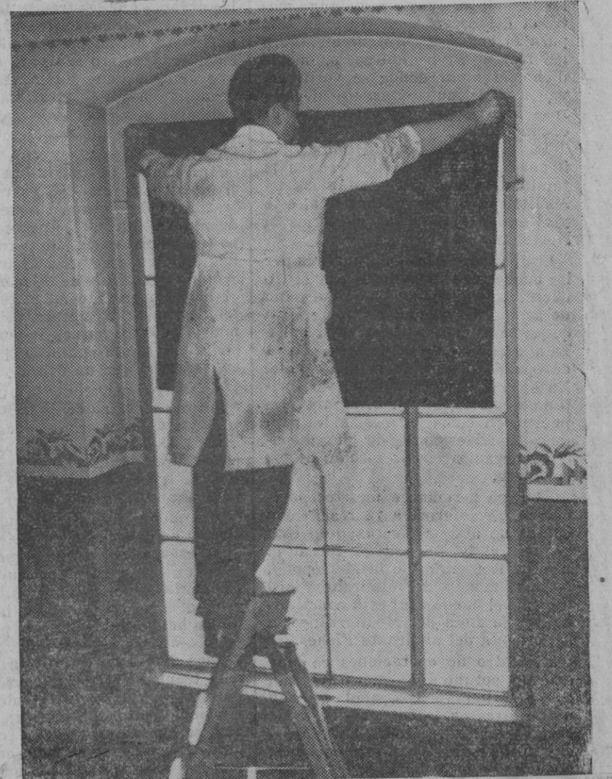
Como ya ha comunicado la prensa se han efectuado en Berlín y especialmente en las cercanías de Tempelhoff maniobras civiles para defensa contra ataques aéreos. Todos los ciudadanos debían tomar parte bajo severas multas en caso de incumplimiento. Un ciudadano tapando una ventana, para evitar la luz.

Así; si hojeáis los anuarios militares anteriores a la desdichada actuación de aquel ministro de la guerra, vereis un rosario de nombres