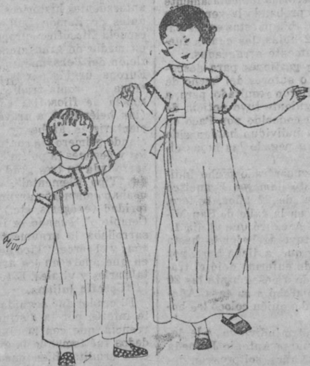
Camisas de noche para niñas de seis u diez años de edad.

La primera en rosa vivo, festoneada en un tono algo sostenido en el cuello y los brazaletes de las mangas muy cortas.