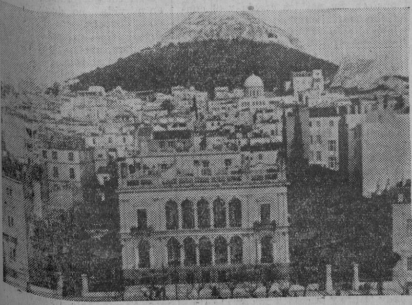
Una vista general de Atenas, sobre la que actualmente se concentra la atención mundial.