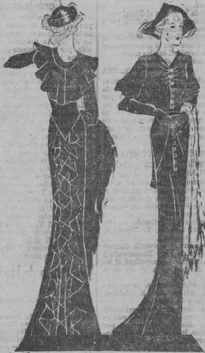
Los negros fundamentan una disciplina sometida a las alteraciones en boga.

atenta solo a exaltar serenamente sus cualidades físicas que en este día afortunado de boda, consultare la fiesta mayor dedicada a su persona.