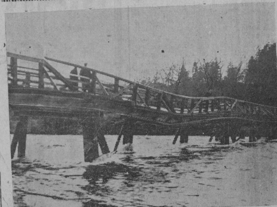
LOS DESTROZOS DEL AGUA EN ESCOCIA. — Un aspecto de las inundaciones en el distrito de Kilmorack. Un puente de madera seriamente deteriorado amenaza ser arrastrado por el agua. (Express Foto).

EL PRIMER ANIVERSARIO DE LA MUERTE DEL REY ALBERTO I DE BELGICA. — Se ha celebrado en la Iglesia de los Inválidos. El Príncipe Javier de Borbón, La Princesa Sixta de Borbón y M. Pietri, ministro de Marina, saliendo de la iglesia de los Inválidos. Express-Foto.