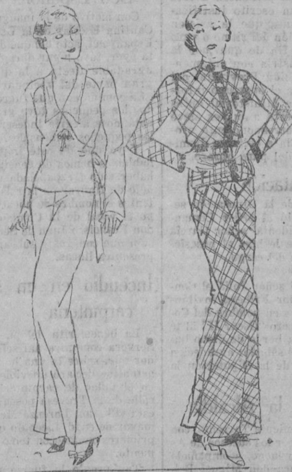
En lana y franela, con asociación de escocés y a un solo tono.

Reunimos dos modelos de pijamas con mangas muy a propósito para la