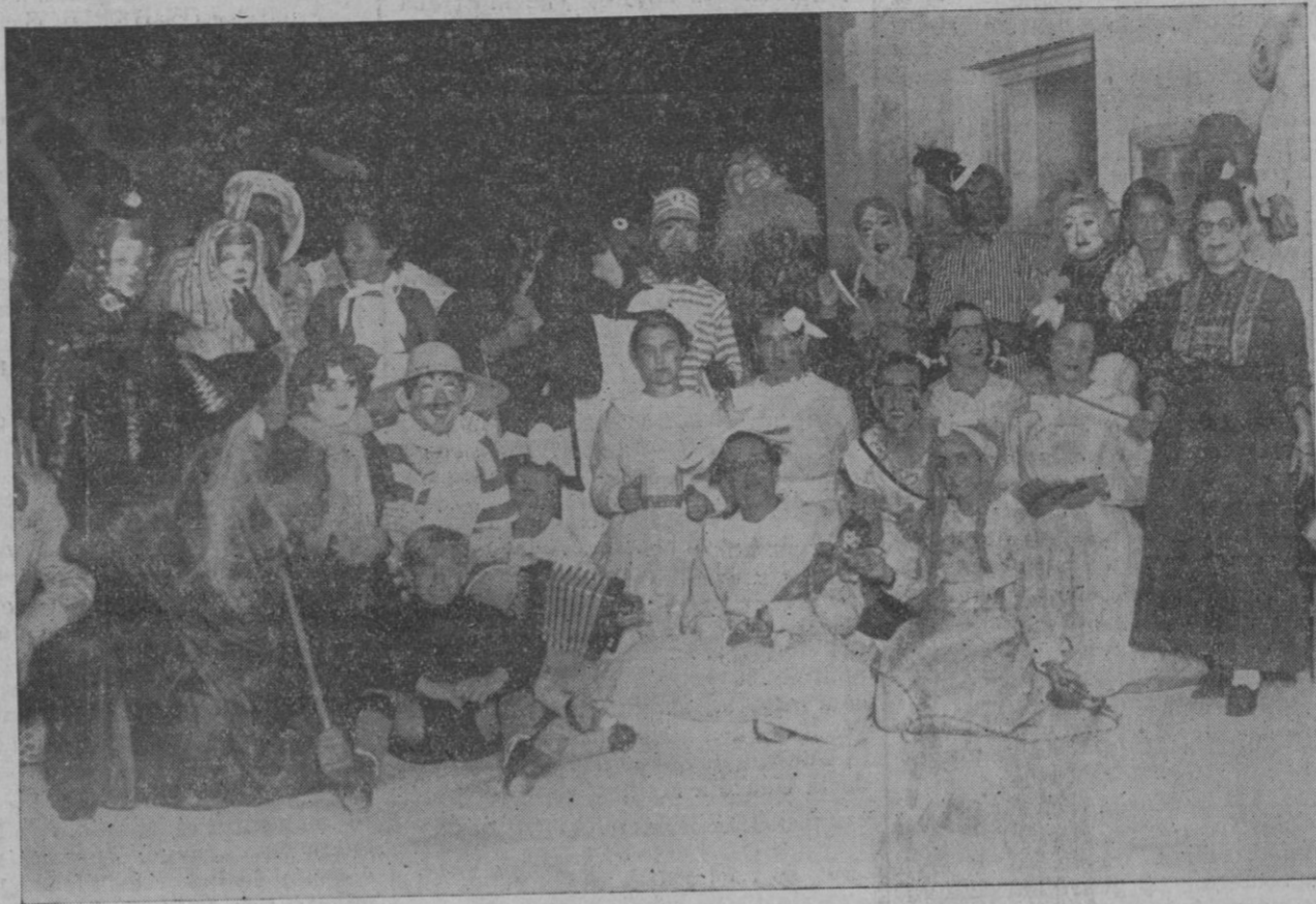
Grupo de máscaras que concurrió al asalto en el chalet de Lawn Tennis Club.