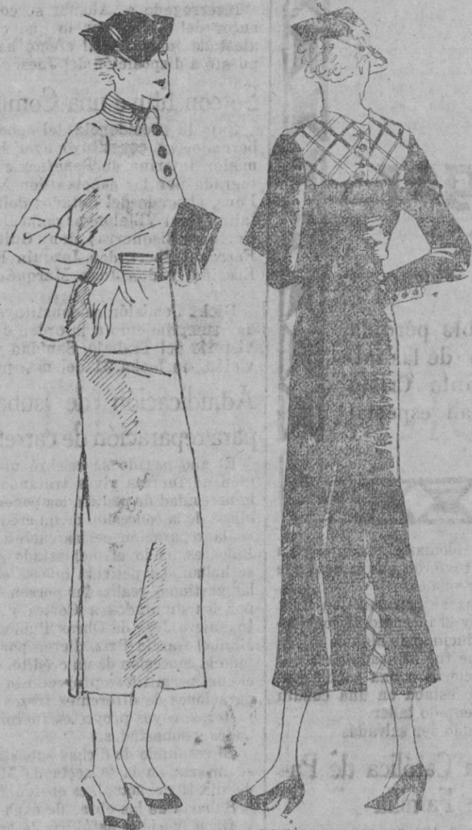
Las confecciones nuevas, ajustadas y semiajustadas.

Miremos el panorama futuro de nuestras devociones. Y observemos que el principio tan puesto en práctica durante el pretérito año, insiste y se renueva en el advenimiento del presente. Las confecciones ajustadas, semiajustadas solamente, discurren en una repetición si que también más graciosa y original. En el dibujo, os ofrecemos dos trajes que trazan el testimonio elocuente