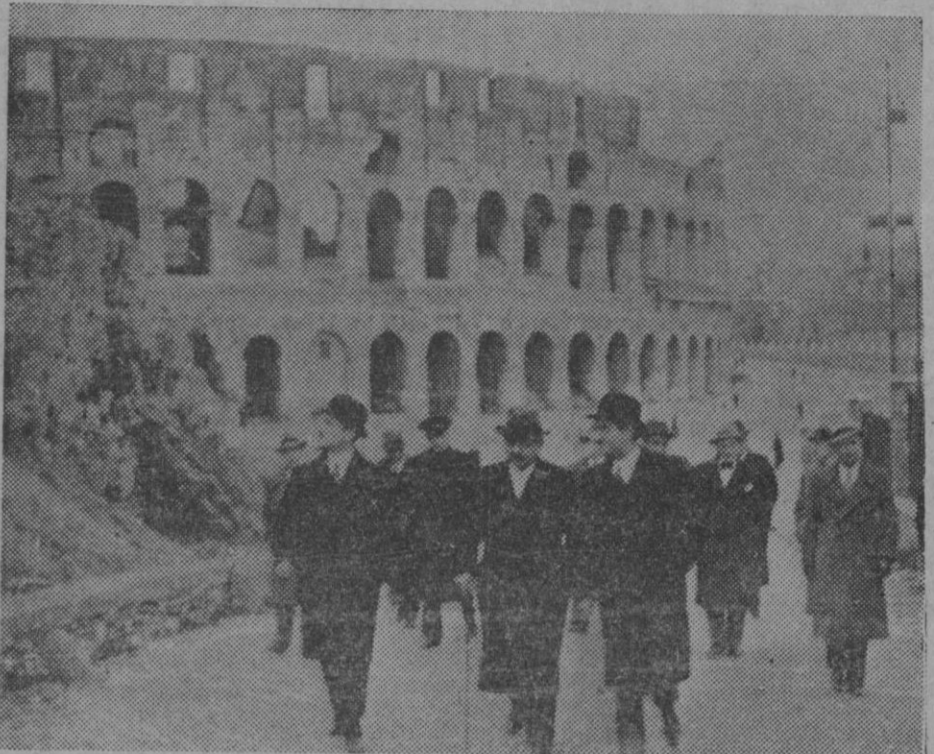
M. LAVAL, VISITA LA ANTIGUA ROMA.— Durante los cortos espacios que las conversaciones políticas le dejaron libres el Sr. Laval no deja de visitar los imponentes vestigios de la antigua Roma. M. Laval delante del Coliseo.

Mucho celebraremos que la autoridad municipal siga prestando a esta cuestión mayor atención cada día.