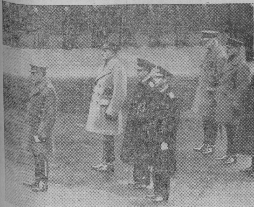
LA CELEBRACION DEL ARMISTICIO EN LONDRES. — El Rey, el príncipe Arturo de Connaught, el Príncipe de Gales y el duque de York, guardando un minuto de silencio ante el cenotafio, con motivo del aniversario del armisticio.

En aquellas zonas de España, en que predominan la industria minera y sus derivados, nos encontramos con que al Sur de la Península, una de las zonas mineras, están sin guarnición Huelva y Jaén (hierro, cobre, carbón, plomo, plata); Granada (cobre, azogue, fábrica de polvoras y explosivos) dispone de un Regimiento de Infantería y uno de Artillería ligera; Almería (hierro, plomo) de un Batallón de Infantería. De las restantes guarniciones del Sur, cuyas poblaciones no están tan afectadas por la minería, no puede sacarse un hombre, pues no disponen más que de un sólo Regimiento, que de ocurrir algo, en la referida zona, con defenderlo suyo tienen de sobra. Puede exceptuarse Sevilla (Cuartel General de la 2.ª División) que dispone de un Regimiento de Infantería, otro de Caballería, otro de Artillería ligera y de un Grupo de Intendencia; de esta guarnición podrá sacarse fuerza, que si es de Caballería, probablemente tendrá que combatir como Infantería, a lo que no está preparada, y, en último caso, si de lo que se trata es