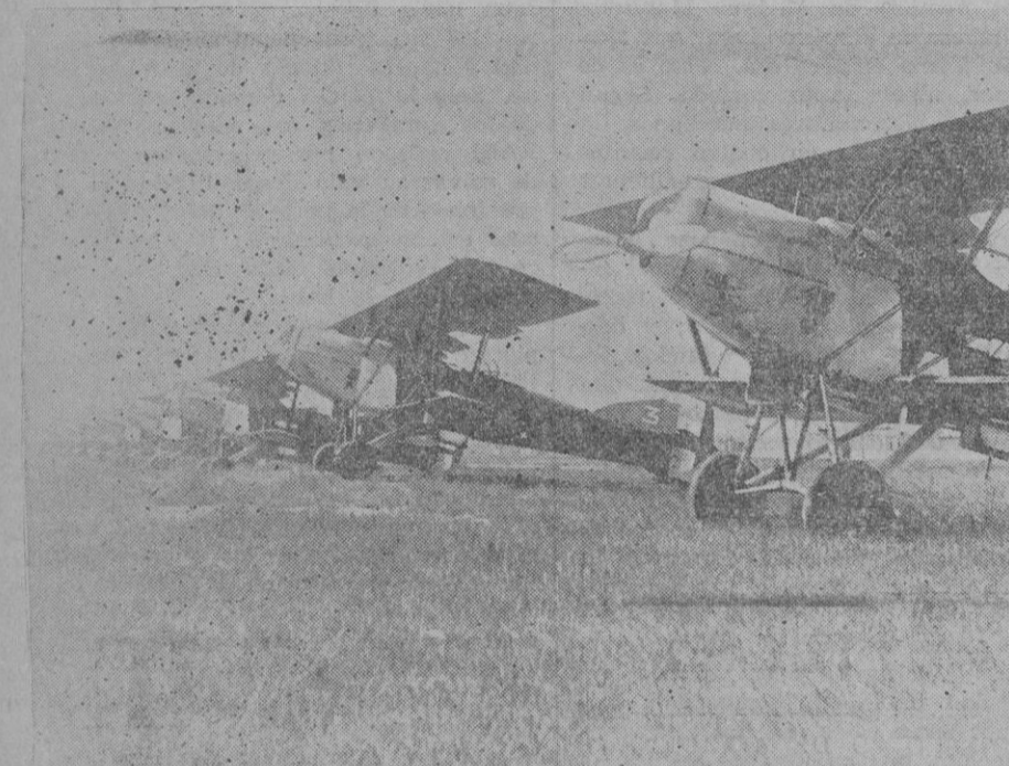
MAS MANIOBRAS MILITARES. — Francia celebra sus maniobras aéreas, en el Norte, Escuadrilla de aviones destinada a la defensa de la capital preparada para un simulacro de combate.