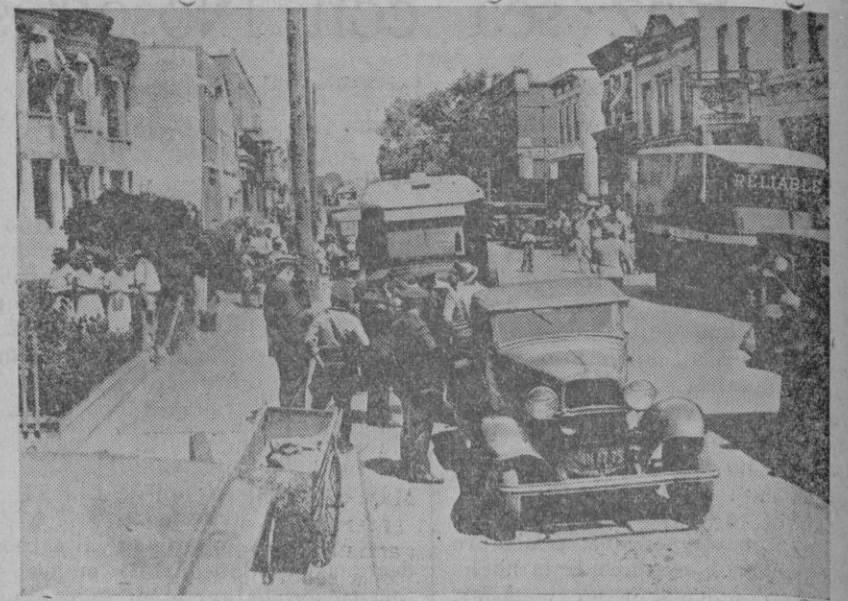
BROOKLYN. — Los gangsters de Brooklyn, roban 500.000 dólares.—En pleno día y con una audacia extraordinaria, en el momento en que el camión cargado con su preciosa carga iba a emprender el viaje, una porción de ametralladoras de brazo aparecieron amenazando a los guardias que custodiaban el camión obligándoles a la impotencia, apoderándose los «gangsters» de 500.000 dólares. — Al fondo, a la derecha, el camión que transportaba el dinero.