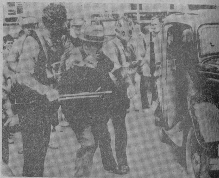
CUANDO LOS POLICIAS SE CONVIERTEN EN «GANGSTERS»... El hecho es raro, pero ha sucedido recientemente en Nueva York, aunque solamente de una manera ficticia, para dar lugar a los representantes de la Ley, a entrenarse debidamente para cuando «la cosa vaya de veras». Momento de ser detenido un «falso gangster» por sus propios colegas.