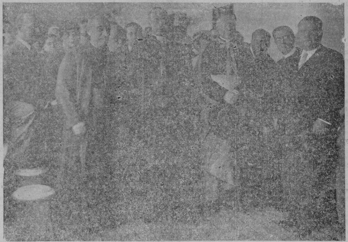
UNA PERSONALIDAD RELIGIOSA EMBARCA EN BARCELONA PARA BUENOS AIRES.—El representante del Papa, el Cardenal Pacelli, que ha embarcado en Barcelona a bordo del «Conte Grande» para Buenos Aires, donde presidirá el XXXII Congreso Eucarístico Internacional.