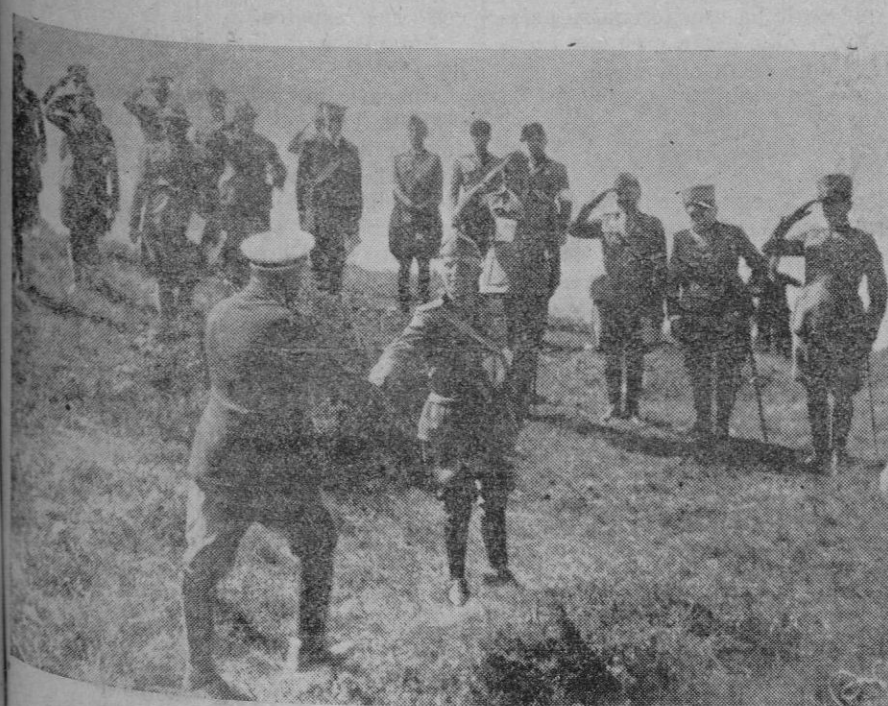
LAS GRANDES MANOBRAS ITALIANAS.— En presencia del rey Víctor Manuel, del duce y de los ministros han tenido lugar las grandes maniobras italianas. — Ved aquí al Rey estrechando la mano a Mussolini, en el campo de maniobras