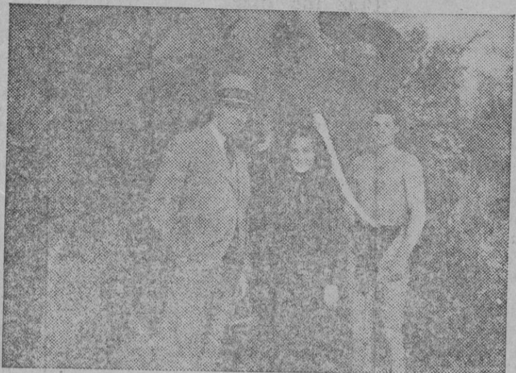
El famoso autor de los escenarios de «Tarzán», Edgar Rice Burroughs, posa ante la cámara acompañado de dos intérpretes de sus obras, Moreen S'Ullivan y Jonny Weissmuller al amparo de un fondo sugestivo, uno de los elefantes que tan excelente intérprete sabe ser en esta clase de trabajos.