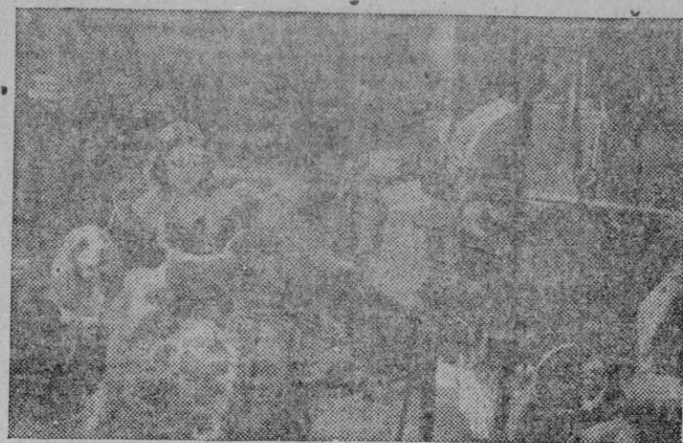
Algo alejada del trabajo intenso de los estudios, Norma Shearer vuelve a sus actividades para impresionar «El amor de una mujer». El fotógrafo ha tomado este momento de un descanso de Norma en los propios estudios.