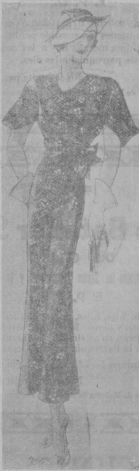
Elegante vestido estampado en negro y amarillo limón

lavan con jabón moreno, gosa y potasa. Deben ser esmaltadas de blanco. Para concluir diremos que tanto estropajos como esponjas deben lavarse y dejarse secar muy bien de una vez para otra y que los paños que se emplean en limpiar vasos, tazas y platos sean distintos y apropiados para cada uso.