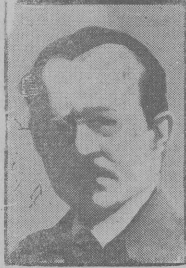
EXTRANJERO.—Leon Koslowski, es el nuevo jefe del Gobierno polaco recientemente establecido