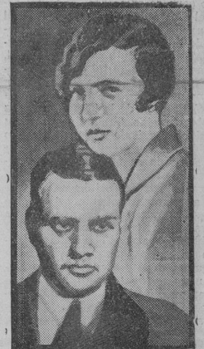
La Princesa Ingrid, hija del Príncipe heredero de Suecia y hermana de la Reina de Bélgica, Astrid, cuya boda con el Príncipe Federico, heredero de Dinamarca, ha sido anunciada oficialmente