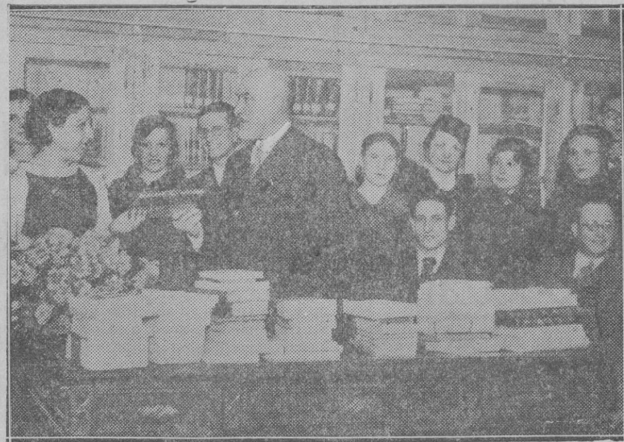
MADRID. — El director de la Escuela Social haciendo entrega de los premios a los graduados

la vez en la disminución de sus propios armamentos, es menester que exista la seguridad de que el Estado atacado pueda contar con el apoyo de los demás países. La petición francesa es lógica y la reconoce el mismo Estatuto de la Liga de Naciones, pero como los Estados no están obligados a reconocer el fallo de la Liga, la obligación de la mutua asistencia queda letra muerta. El Pacto Kellogg, por su parte, representa un proceso, hasta comparado con el Estatuto ineficaz, y tan sólo tiene fuerza moral. Ciertamente, los Pactos de Locarno tienen importancia más positiva, puesto que disponen que Inglaterra e Italia acudirán al socorro de Alemania o Francia, en el caso de que una de estas Potencias atacase la otra. Pero en Inglaterra existe una campaña enérgica contra Locarno, y