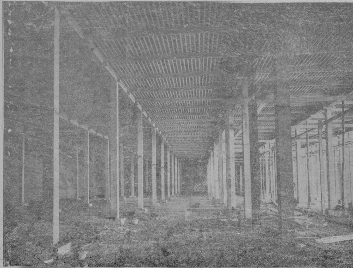
INTERIOR DE UN DEPOSITO

una peseta de venta en la librería de J. Tous.