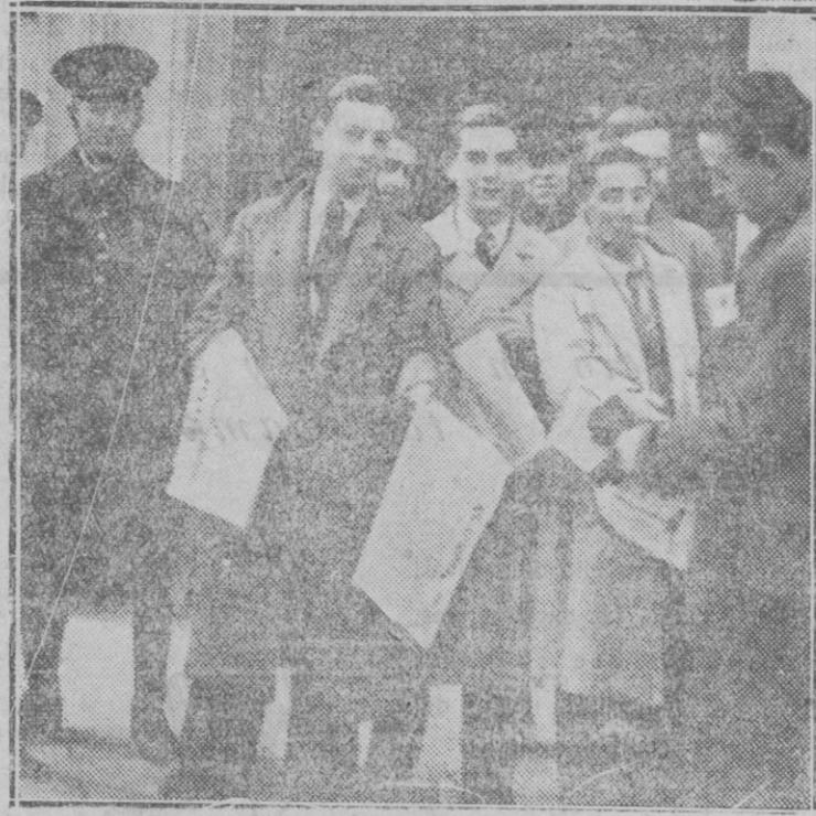
MADRID.—Jóvenes entusiastas de Acción Popular vendiendo «El Debate», custodiados por la fuerza Pública.

Pero, resulta que los pueblos por apetitos subalternos en cuyos planes entra la ambición nacionalista y el espíritu de conquista, para no confesar sus propios errores, fomentan la creencia de que la Liga de las Naciones siendo una panacea es incapaz de arreglar los asuntos internacionales, por lo que ellos deben hacerse justicia por