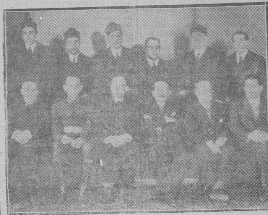
MADRID. — Los condenados en la causa por los sucesos de Agosto en Sevilla, en grupo con sus defensores

«Algo verdaderamente nuevo». Los que reclaman con ardimiento esta fórmula de prodigio, que sólo puede simular un taumaturgo, ignoran en general las condiciones en que funcio-