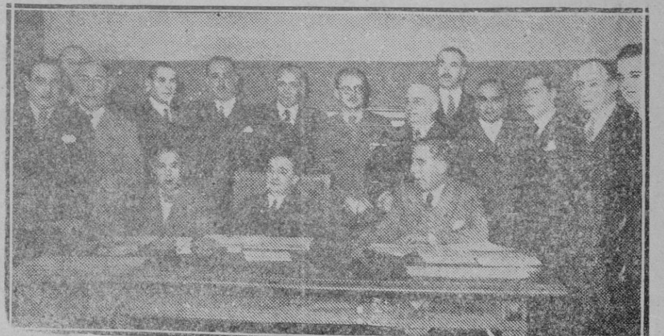
MADRID. — En el Congreso. — La nueva Comisión de Responsabilidades