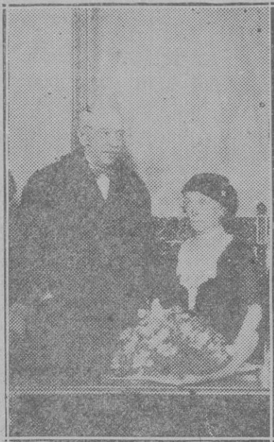
MADRID. — La ilustre escritora Sofía Casanova después de su conferencia en la Asociación de Escritores y Artistas