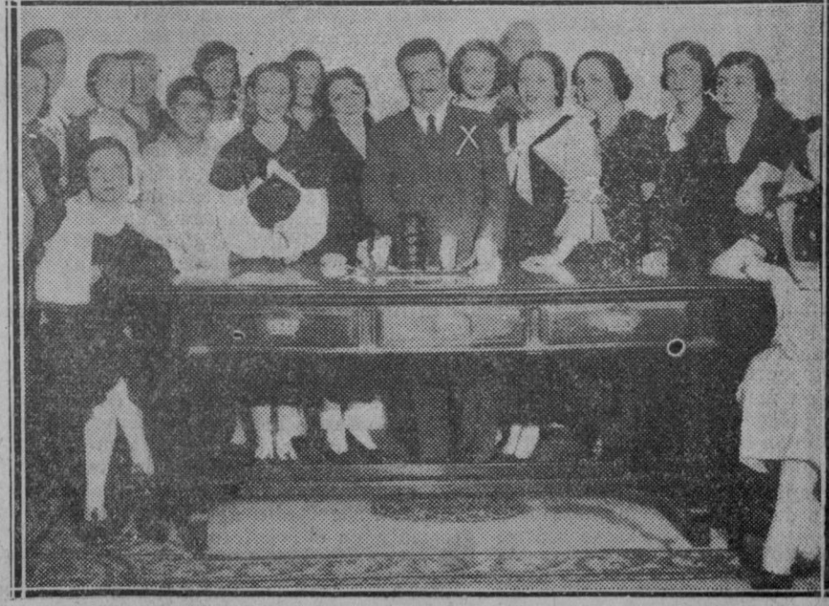
MADRID.—El Presidente de la Diputación Provincial, Sr. Salazar Alonso, en «España Femenina».

Y los mozos, de noche, no tienen mas distracción que apedrear las puertas de la ciudad o de las mozas huérfanas y de buen ver. Bajo su aspecto brutote y taciturno, se esconden unos perfectos salvajes. Tampoco hay Guardia Civil. Y si la hubiera — ¿para qué? — se casarían en el pueblo; adquirirían fincas e intereses; amistades y parentelas; tampoco habría justicia.