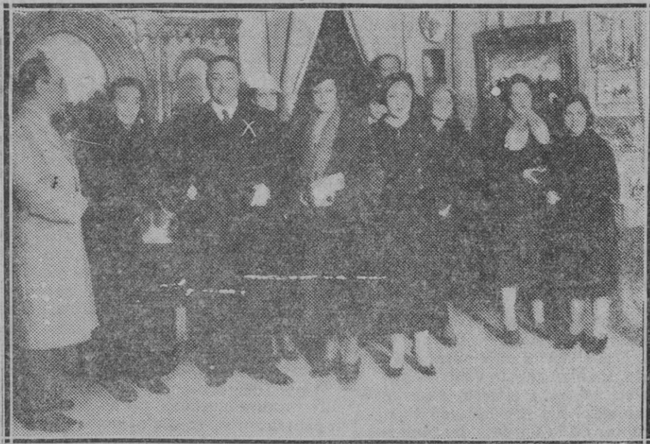
MADRID.—El Sr. Martínez Barrios en la inauguración de la Exposición de Cerámica de Zuloaga.

Una vez más señalamos la necesidad de que se haga esto. Nos mueve a instarlo el cariño que a nuestra región profesamos y el deseo vivo que sentimos de verla prosperar y engrandecerse cada día más.