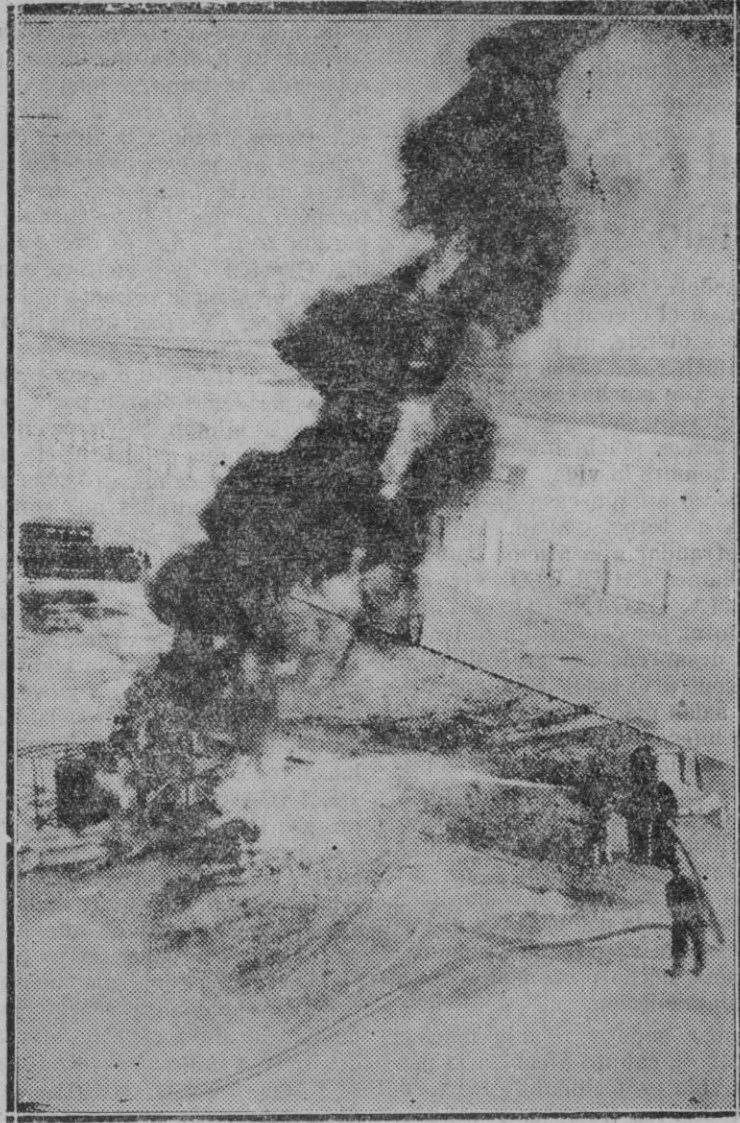
NORTEAMERICA. — Los bomberos trabajando en la extinción del incendio del aparato que pilotaba el aviador De Pinedo.

Toda atención que a esta riqueza se preste y cuanto apoyo se nos preste por parte del poder público para incrementar la se habrán de ver colmadamente compensados por los beneficios que nuestra región y la economía nacional han de recibir del desarrollo de esta industria, cuyo próspero desenvolvimiento que se acusa en la estadística facilitada por el Patronato Oficial de Turismo es prometedor de un mayor desenvolvimiento que debemos apetecer y que debemos posibilitar.