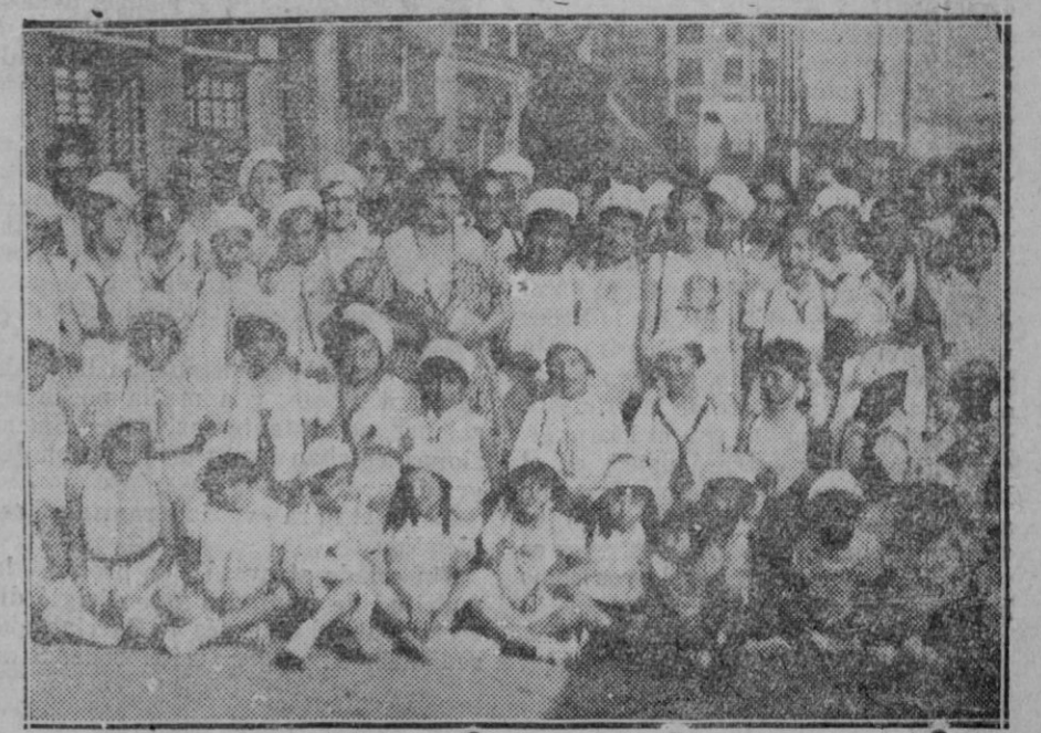
MADRID. — Los Legionarios de la Salud momentos antes de salir para la Granja, en donde han fijado su colonia veraniega

La Conferencia de Montevideo va a actuar doctrinalmente como una Sociedad de Naciones, discutiendo, en realidad, no problemas de aislamiento de América y de singularidad de América, sino todos los problemas que conturban el mundo y que mejor o peor, viene estudiando con toda suerte de técnicos, sociólogos y políticos teorizantes el complejo organismo de Ginebra, con sus ramificaciones de La Haya y Basilea, y que en estos días mismos se estudian en Londres: "Organización de la paz, comprendiendo el pacto Briand-Kellogg y el procedimiento de conciliación; problemas de derecho internacional de asilo y extradición (¿no es el sentimiento fascista y dictatorial quien promueve este tema, no americano?) derechos políticos, y civiles de la mujer; cuestiones económicas y financieras, comprendiendo la estabilización de los cambios, el arbitraje comercial, los contingentamientos, los derechos de aduanas y las barreras tarifarias; problemas sociales, tales como habitaciones obreras, seguros sociales, Oficina del trabajo de Ginebra, etc., etc., (en estos etcéteras debe estar enmascarada la jornada legal de 30 horas, que amenaza con nuevos encarecimientos a la producción yanqui); la cooperación intelectual; las vías de comunicación; navegación fluvial, ferrocarriles, avia-