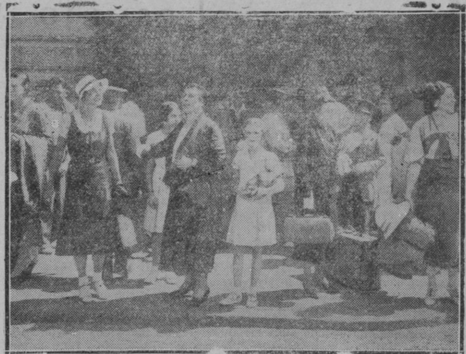
Llegada a Madrid de los estudiantes expedicionarios que ha hecho el crucero mediterráneo

Gemelos en el sentir, son antípodas en los ruidos. Gracioso ambos, con desenvoltura y simpatía para dominar a los públicos; pero residiendo la fuerza del uno en su valor a prueba de sus-