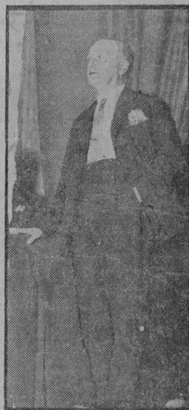
Sr. Largo Caballero, Ministro del Trabajo, que ha dado una conferencia en el Coliseo Pardiñas

Los técnicos oficiales a sueldo de los Estados y de los financieros, y los sociólogos que se congregan en la Oficina Inercial del Trabajo y los gobernantes enloquecidos por las ingenierías del Estado-púedelotodo se preocupan ahora, como fórmula de solución única para la crisis mundial, de revalorar los precios de las mercancías y las remuneraciones del trabajo, queriendo vencer con arbitrios artificiales la ley natural más poderosa que regula la vida humana. "¿Qué no hacen los