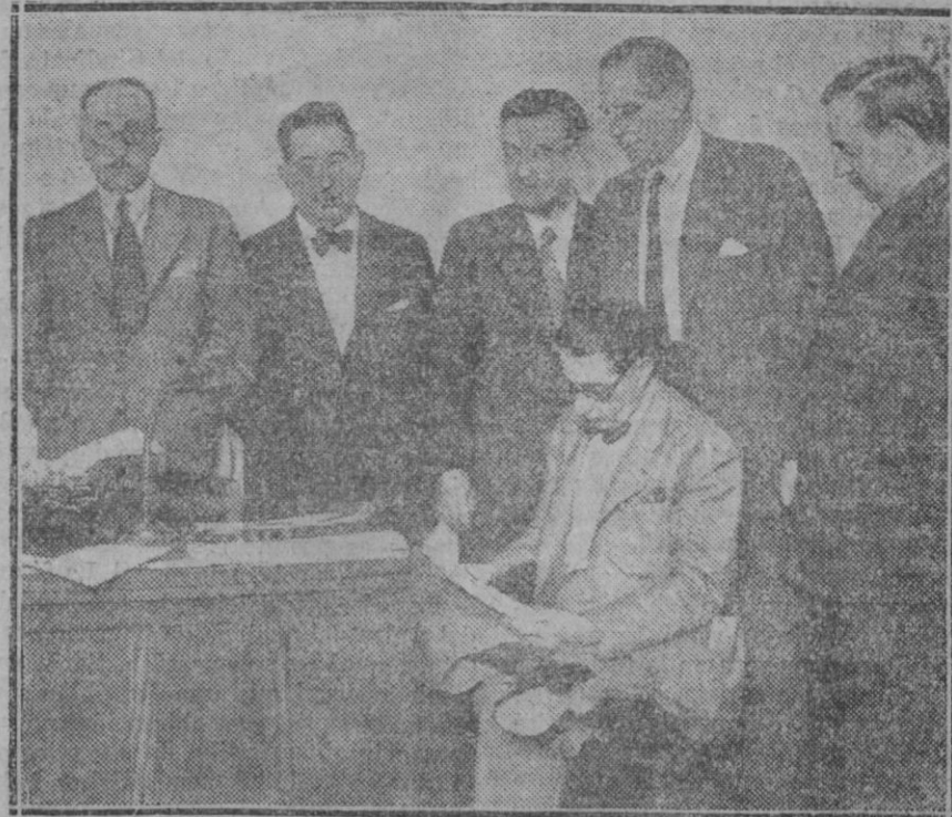
EN EL CIRCULO DE LA UNION MERCANTIL.—La junta directiva al hacerse nuevamente cargo del Círculo abriendo las dependencias que estaban prescintadas

Ahora, la Conferencia del Otawa francés, la Conferencia Colonial que