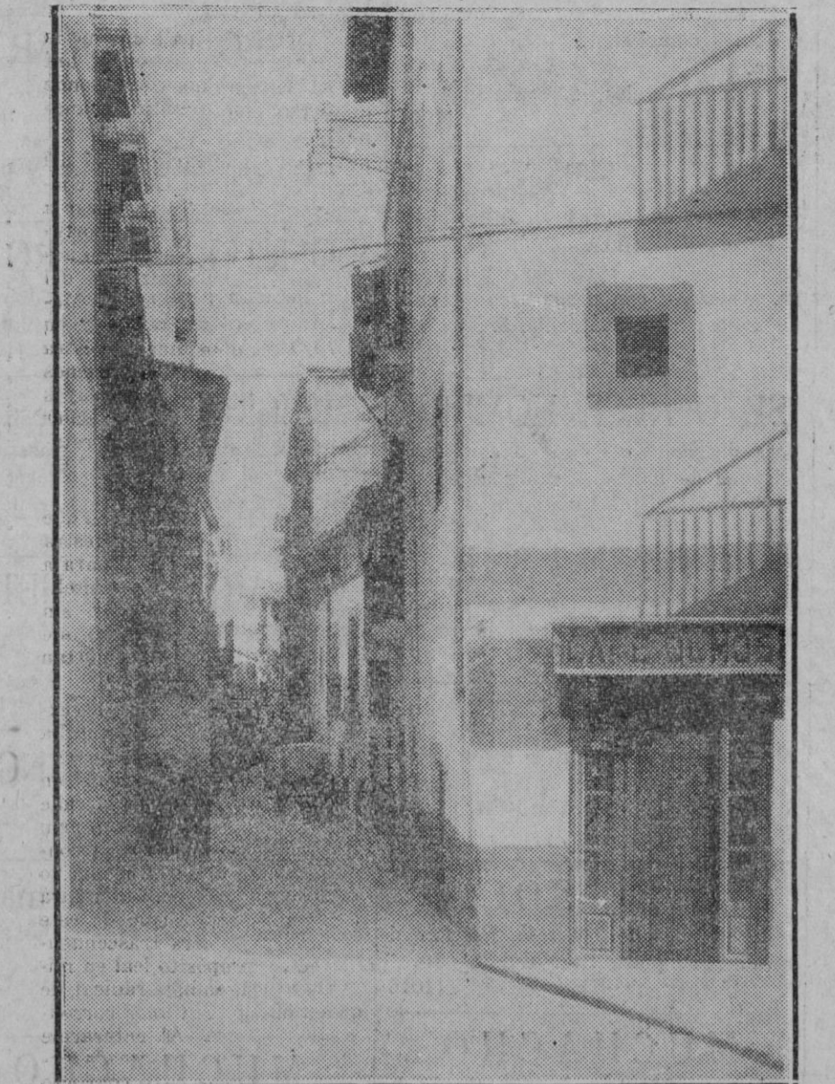
Vista de la calle de la Misión con la que enfrenta la nueva calle de Font y Monteros