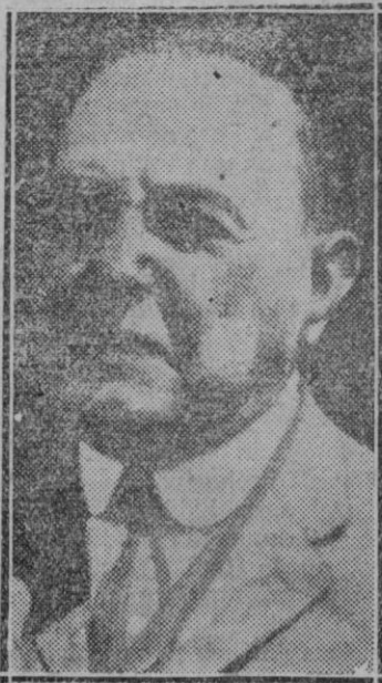
BUENOS AIRES — Ha fallecido en esta capital el ex Presidente de la República Argentina doctor Hipólito Irigoyen.