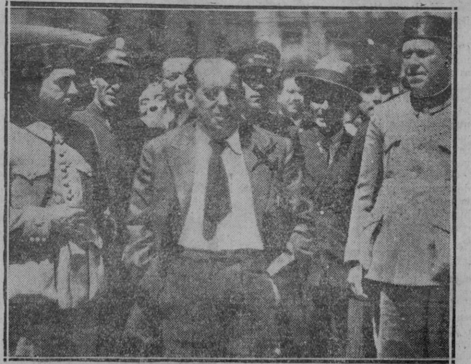
El general Sanjurjo al llegar al Palacio de Justicia para declarar por los sucesos del 10 de Agosto

¿Cuál debe ser nuestra política en cuanto a precios? La terapéutica creo yo que debe consistir en dejar libre juego a la economía, orientar en un sentido capitalista social y dar confianza al capital para que actúe y no se retraiga. Solo así se puede en este aspecto seguir una trayectoria eficaz. Hay que procurar la libertad