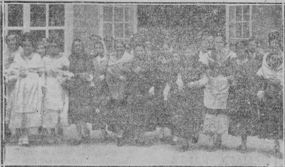
MADRID. — Recibió el presidente de la República a las señoritas que forman los coros Rosalía de Castro, colaboradoras en una fiesta para allegar fondos con destino a un monumento a la insigne poetisa.

Por cierto que esta viva realidad choca con el argumento peregrino de los devotos ministeriales. Se recordará que la Ley de Reforma Agraria fué discutida alternativamente con el Estatuto de Cataluña. La pasión de la opinión pública se concentró en esta Ley de pie forzado por que el sentimiento de unidad prevaleció sobre las cuestiones de redistribución de la propiedad, a pesar del desacierto de aquella tendencia colectivista. Pero entonces se achacó la campaña contra el Estatuto a una táctica pueril que era impugnar la obra de los