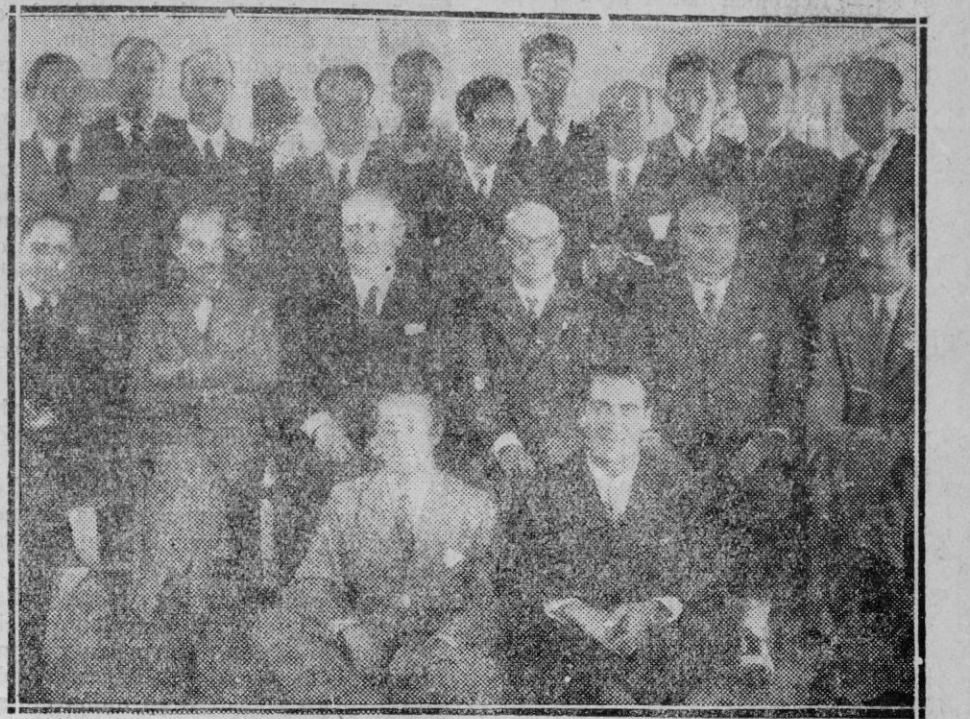
Los alumnos del Instituto Español de Oceanografía que han terminado sus estudios, reunidos con el Director y Profesores de dicho Centro

Y he aquí que otra mujer encerrada en el departamento de un tren ocultaba su rostro y lloraba amedrentada durante el transcurso de aque-