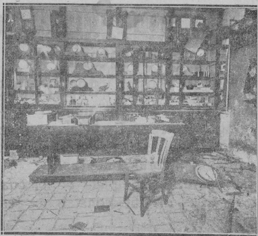
TERRORISMO EN BARCELONA. — La relojería de la calle de la Diputación después del atraco realizado en ella, conforme dimos cuenta, y de la explosión de la bomba dejada allí por los pistoleros

Conocida de antemano nuestra opinión acerca del particular, huelga decir con cuanto agrado vemos el acuerdo tomado por la Corporación Municipal, a la que nos es grato aplaudir por estimar acertada su resolución y beneficiosa ésta para los intereses de la ciudad a más de conveniente para seguridad del vecindario.