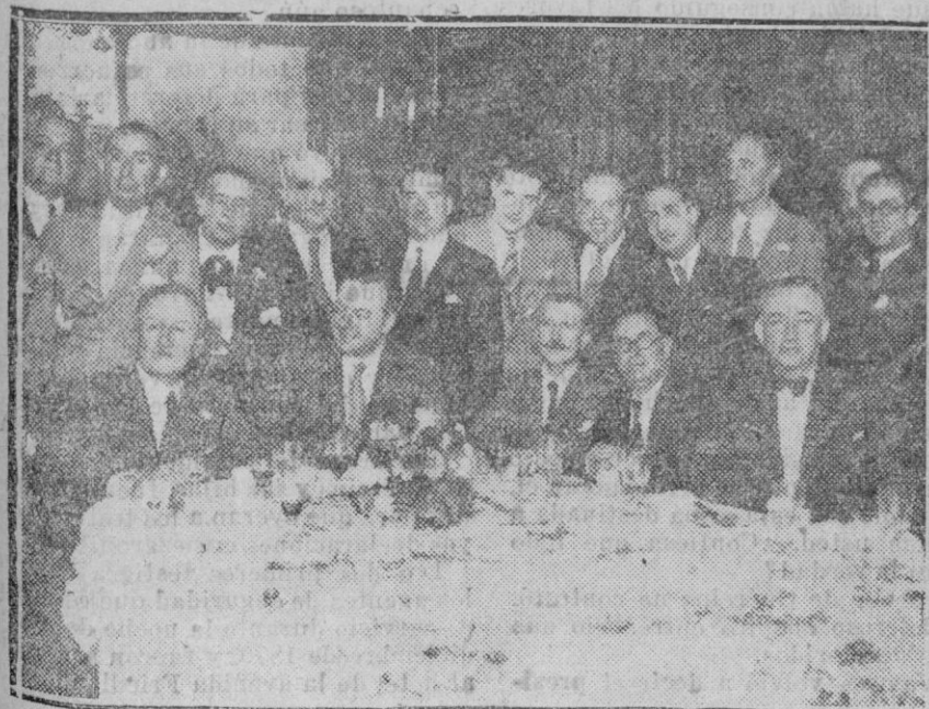
MADRID. — Almuerzo que el maestro Guerrero obsequió a los colaboradores de la temporada teatral y a los reporteros gráficos de periódicos

Como parece ser que lo que ojos torpes tomaron por deseo de promover cruenta y fratricida batalla, no