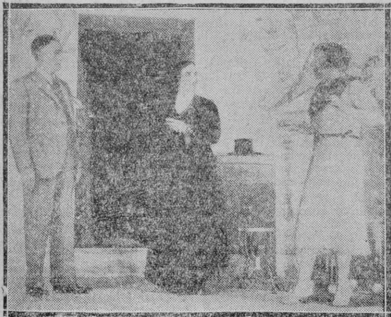
Una escena de «Las ermitas», comedia de Fernández Sevilla y Sepúlveda, estrenada en el teatro Lara

No se han declarado satisfechos los jefes de la oposición con el discurso del Sr. Azaña. El Sr. Lerroux entiende que la invitación a una inteligencia es simplemente una reproducción desvaída, del cuento del portugués, dispuesto a perdonar la vida al que le sacara del pozo. Porque es cierto que el Gobierno declara que ni un mes, ni un año, ni en muchos ha de ser derrotado por la obstrucción. Y a renglón seguido se afirma que las Cortes deben cumplir plenamente su función. Pero lo que se olvida en este argumento es que a las oposiciones no les importa la vida, ya de suyo prolongada, de las Cortes Constituyentes. Por eso han fijado el tope en la ley relativa al Tribunal de Garantías Constitucionales; esta ley de carácter supraconstitucional, ha de ser aprobada, taxativamente, por estas Cortes. Nada más. Las oposiciones niegan, en adelante, la doctrina gubernamental de las leyes que, a su juicio, deben ser discutidas y aprobadas como herramientas de política de