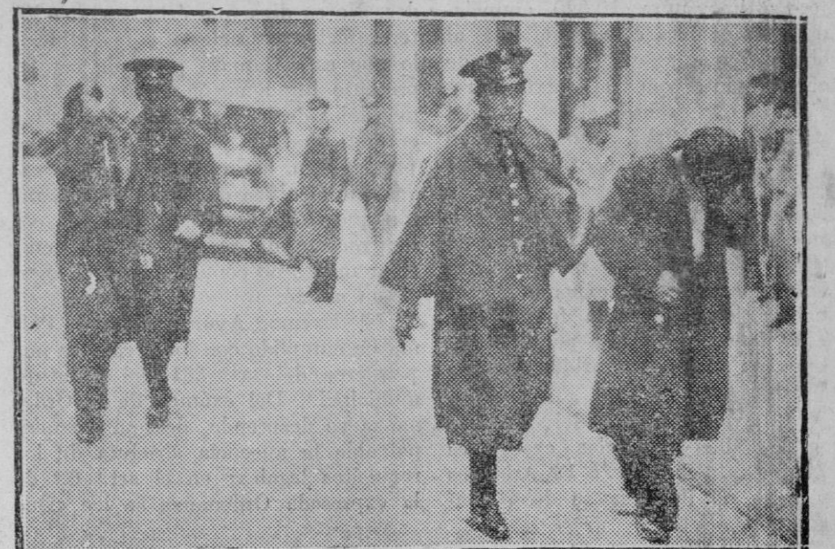
Una nota de los disturbios de Madrid; detención de dos comunistas que tomaron parte en los desórdenes