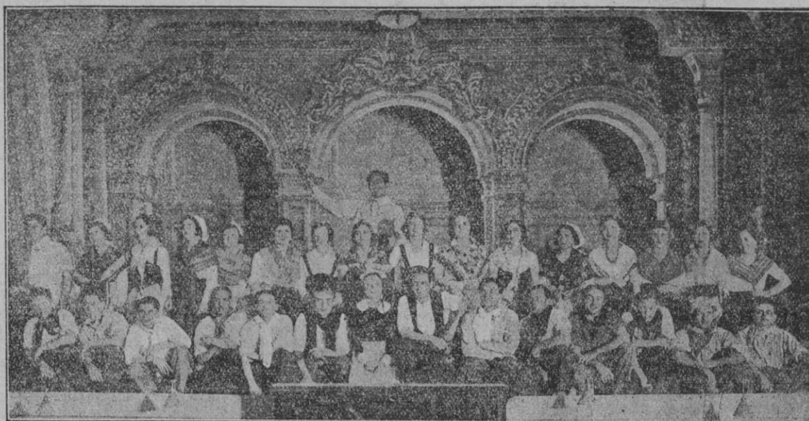
Pareja cómica y coro de la obra «Amor de muñecos», que se representará mañana martes, en el Teatro Lírico por la Agrupación Artística de Manacor, a beneficio de los damnificados de aquella ciudad.