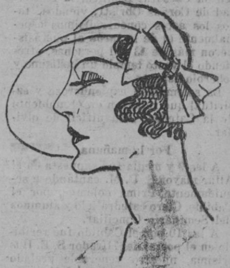
Elegante sombrero en palliósón marfil, lazo de cinta del mismo color