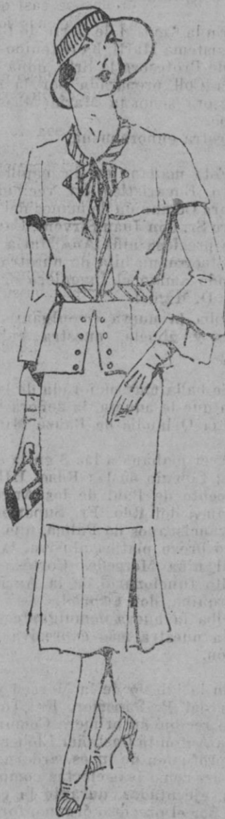
Bonito vestido en cachemira de lana verde esmeralda. Cinturón y cuello-corbata a rayas verde y blanco

De aquí viene la pugna, la dualidad. El marido se torna celoso. Advierte la "postergación". Los mimos y los halagos ya no son para él. Hay quien se los ha arrebatado. Sin comprender, que su mujer, es madre, y el hecho solo la cubre y la santifica. Pero en el matrimonio no hay hijos y ella romántica y sentimental gusta del arrullo y del halago, y el amor germina entre los dos seres sin más complicaciones, ni trabas que su amor.