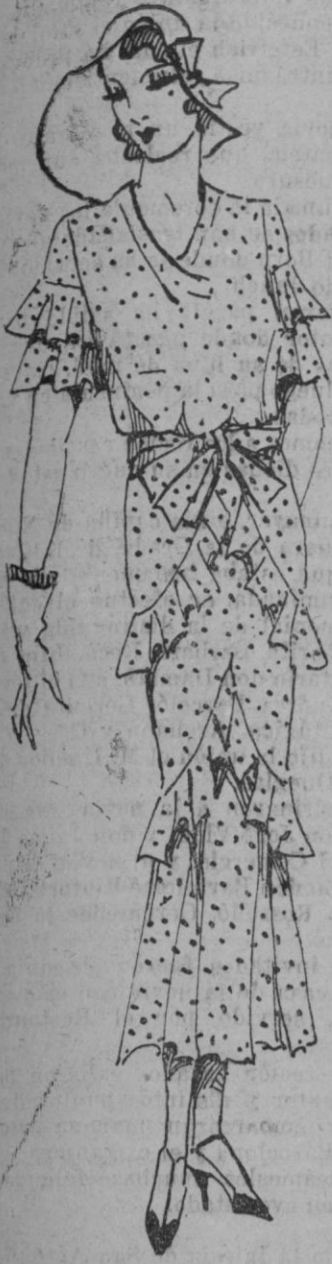
Bonito vestido de pleno verano en muselina blanca con pequeños topos bordados en azul