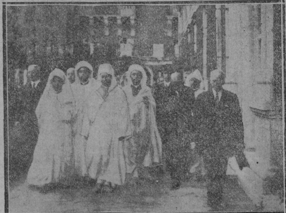
ARANJUEZ.—S. A. Imperial el Jalifa acompañado de varias personalidades visitando el palacio de Aranjuez