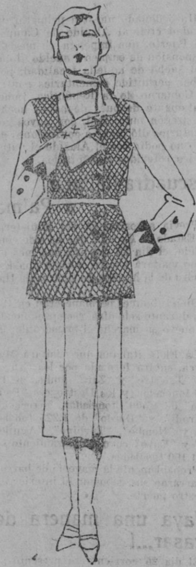
De una hechura muy moderna es este traje para las mañanas en georgette de lana amarilla y georgette de lana cuadrillé, amarillo y negro; botones negros