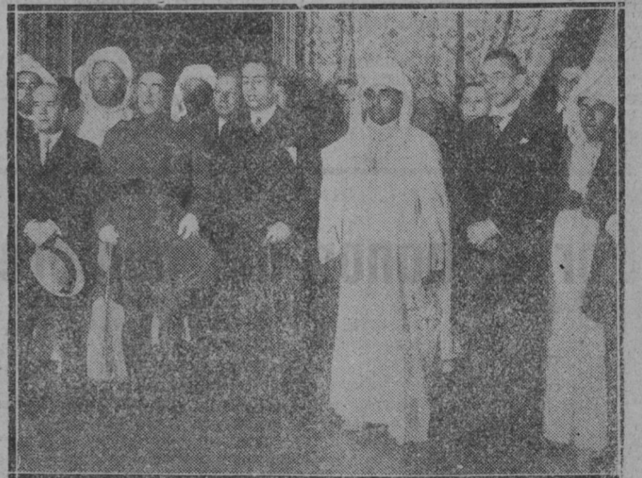
MADRID.—Llegada a esta Capital el Jalifa de Marruecos rodeado de varias personalidades que fueron a recibirle

DE LOS ARTICULOS FIRMADOS RESPONDEN SUS AUTORES. LA PUBLICACION DE UN TRABAJO FIRMADO NO SUPONE LA CONFORMIDAD A LO QUE SUSTENTE. LA OPINION DEL DIARIO ES REFLEJADA POR SUS PROPIOS ARTICULOS