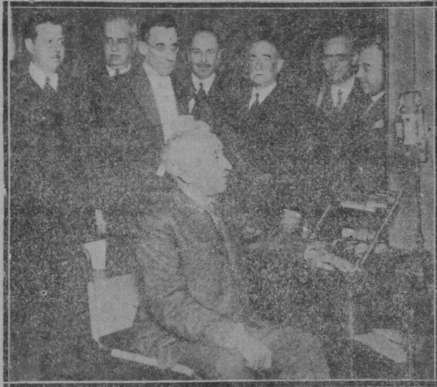
MADRID.—El Presidente de la República durante el discurso que pronunció el sábado, con motivo de la inauguración oficial de la estación emisora E. A. 2, Transradio Española

Por ello nos permitimos una vez más, reclamar del Ayuntamiento una mayor atención y actividad en este asunto, que es de sumo interés para Palma.