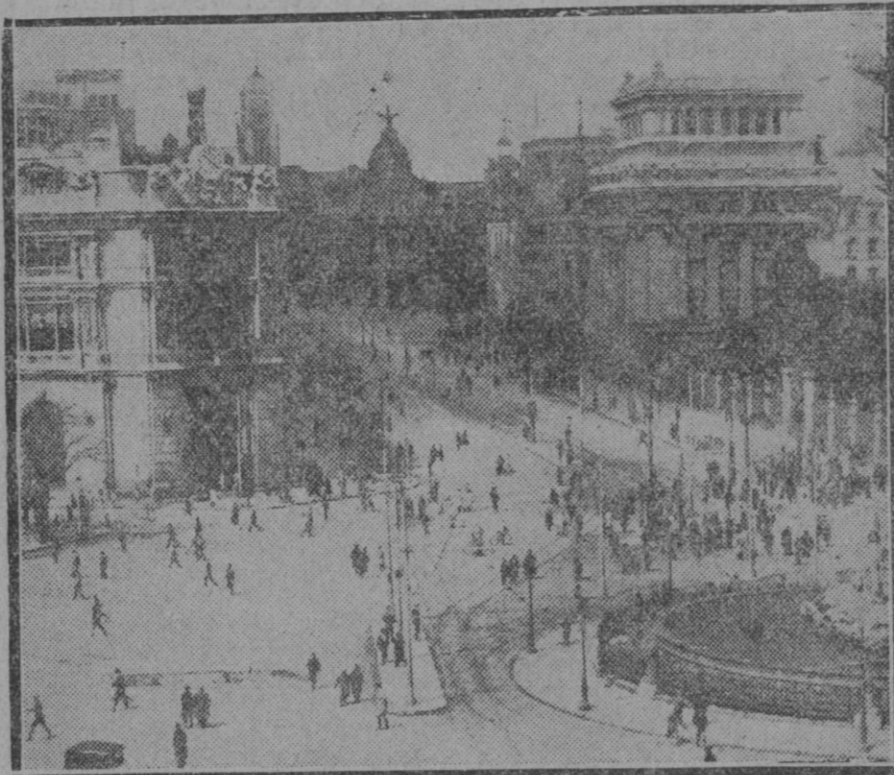
MADRID.—Aspecto que ofrecía la Cibeles y calle Alcalá, cuando los guardias de Asalto dieron la primera carga para disolver la manifestación comunista del 1.º de Mayo

Pregúntense únicamente para qué han de desmantelar el salón de sesiones, y para que han de negar el homenaje que se les rindió a los ciudadanos ilustres de verdadero mérito, y si a estas preguntas no encuentran adecuada, justa contestación, piensen que no tiene justificación su acuerdo.