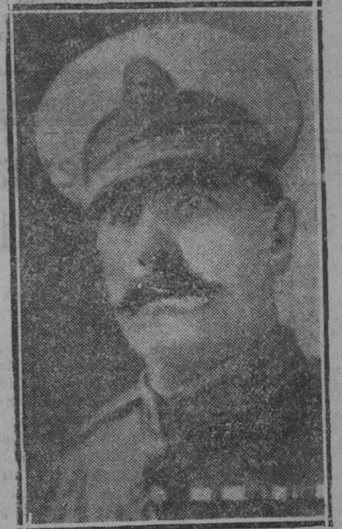
PARIS.—El general José Uruburu, expresidente de la Argentina, fallecido en la clínica donde se había practicado una importante operación