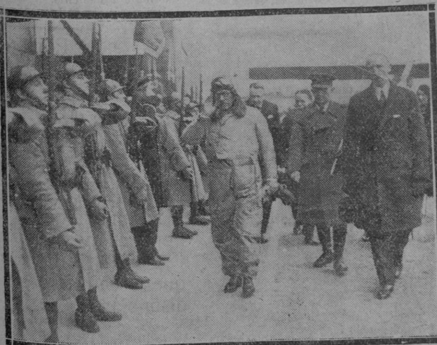
Mister Macdonald pasando revista al destacamento de aviación que le rindió honores en el aeródromo de Bourget en su viaje para conferenciar en París con Mr. Tardieu