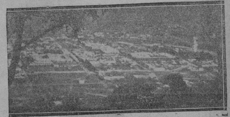
Salta (Buenos Aires). Una de las ciudades de América que a consecuencia de la lluvia de ceniza está completamente inundada y casi incomunicada con el resto de las provincias.