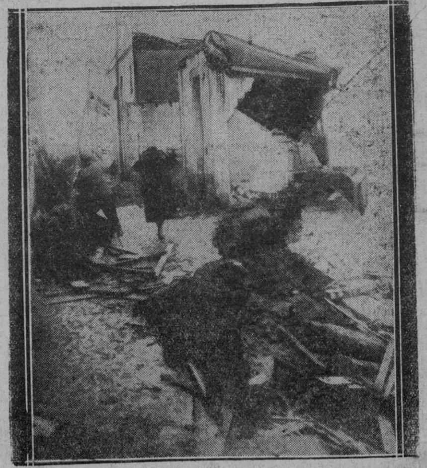
Un detalle de los daños causados por el temporal en el barrio chino de Barcelona