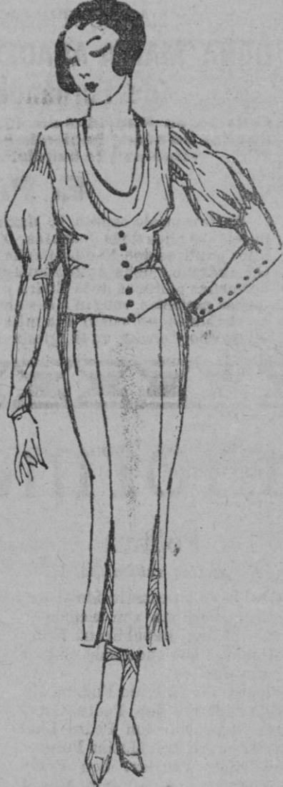
Bonito vestido en crepés romano rosa pálido. Botones negros