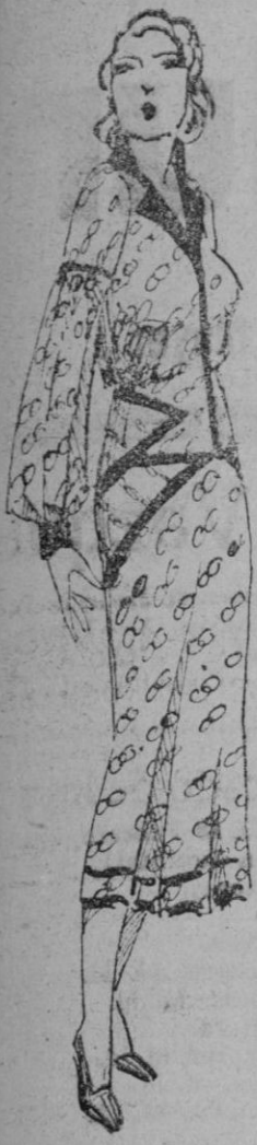
Lindo vestido para casa en crepé estampado amarillo y negro. Guarnecido de negro en crepésaten