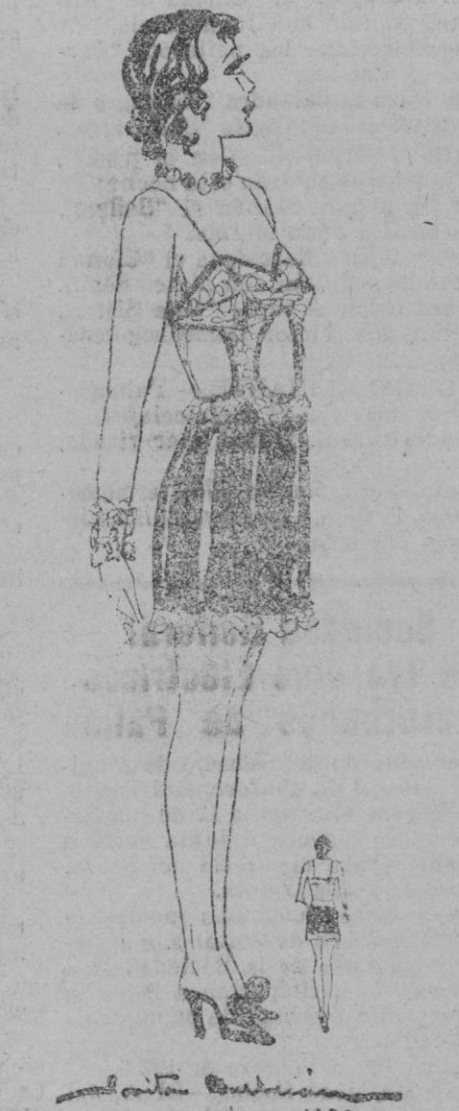
Linda y elegante camisa en crepé de china negro y encajes ocre oscuro

MISS ANY París, Febrero de 1932. (Reproducción prohibida).