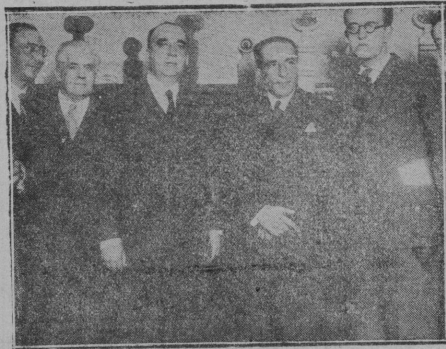
MADRID. EN EL ATENEO.—El eminente matemático profesor Rey Pastor, después de la conferencia que pronunció sobre el tema "La unidad de la ciencia para inaugurar el curso de 1934"

Esas es la situación económica de las clases pobres y de las clases medias, en su mayoría. Los factores psicológicos, se pueden resumir en dos: