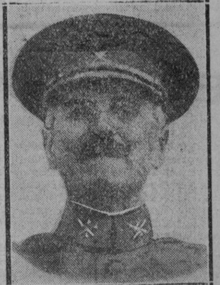
El General Queipo de Llano, Jefe de la Casa Militar del Presidente

También se ha acentuado la creencia de que es resolución inquebrantable de don Fernando de los Ríos de no figurar en el nuevo Gobierno.