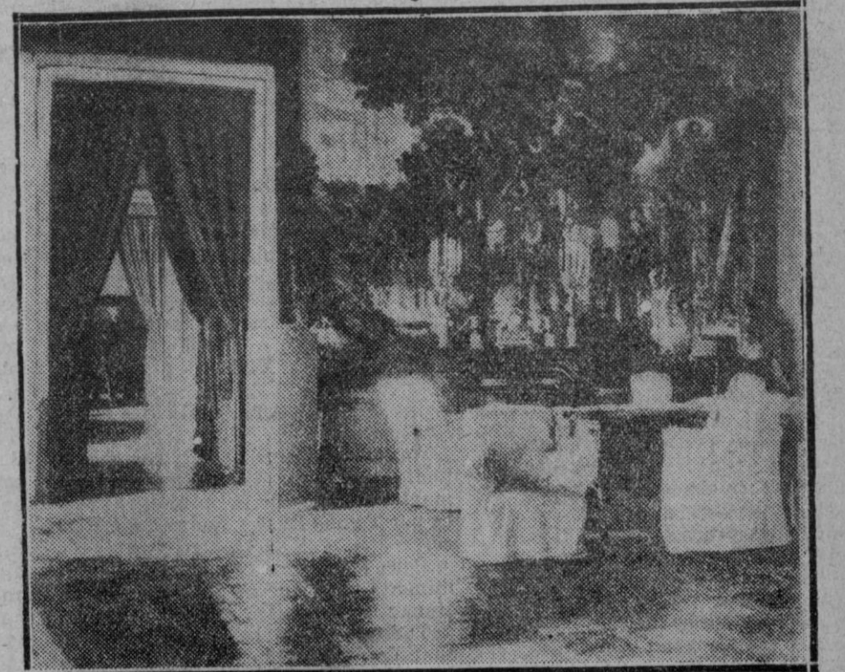
Palacio de la República.—El que fué despacho del ex-Príncipe de Asturias y que ocupará ahora el Presidente de la República señor Alcalá Zamora