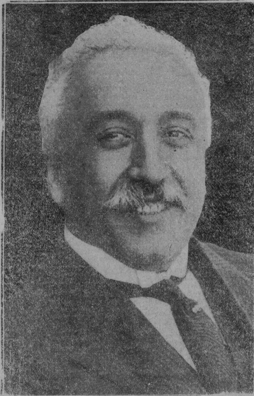
Don Niceto Alcalá Zamora, primer Presidente de la República Española