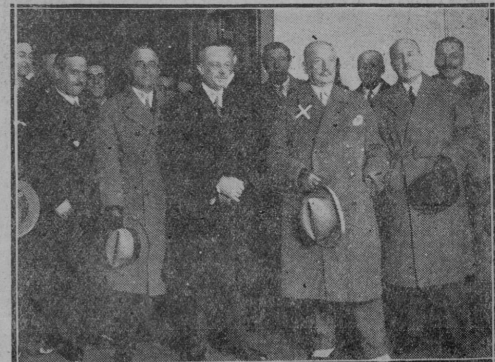
Llegada a Madrid del Residente General de Francia en Marruecos, con nuestro embajador en París. Fueron recibidos por el embajador en Madrid de la vecina república, por el Subsecretario de Estado y otras personalidades.

No ha lugar ni es hora ya de programas y soluciones—que diríamos "robinsonescas, o particularistas. ¿Nos curaremos algún día los españoles de esa enfermedad que Ortega denomina "particularismo"? Ahora, y en economía especialmente a lo nacional hemos de venir y llegar a través de lo internacional o universal. En estos momentos no se puede—por ridículo y estéril—, meditar y proyectar sobre el destino económico y la suerte de un país, sino es la mirada