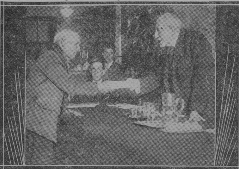
MADRID.—Patronato del Homenaje a la Vejez.—El General Marvá, entregando las libretas del Instituto Nacional a los ancianos pobres de Madrid.

¿No vale todo ello la pena de que el Ayuntamiento estudie con toda detención este proyecto?