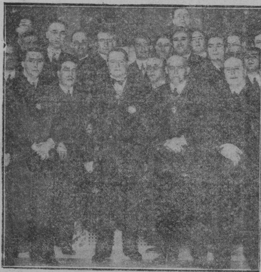
MADRID.—El nuevo fiscal del Tribunal Supremo, don Angel Galarza en el acto de tomar posesión de su cargo

Como ello, por las razones que hemos apuntado conviene a todos, y encierra por tanto un incuestionable interés público, nos place que el Claustro de nuestro Instituto lo haya solicitado al Ministro de Instrucción y al adherirnos a su solicitud, repetimos que quisiéramos que nuestras corporaciones oficiales lo hicieran en nombre de la ciudad y de la región.