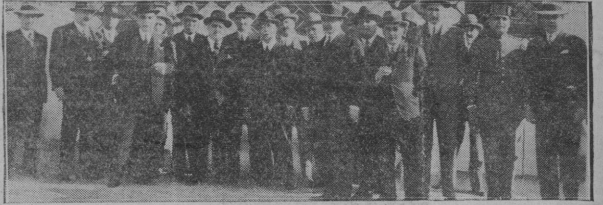
MADRID.—El director general de la Guardia Civil, general Sanjurjo, con los jefes y oficiales de dicho Instituto que le obsequiaron con un almuerzo