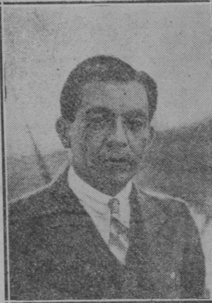
SANTANDER.— El político peruano, el hombre que arrojó del Poder al dictador de Leguía, en el barco que lo trajo a Santander