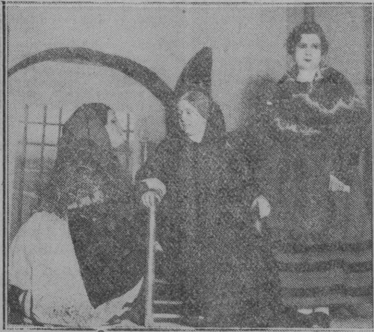
MADRID.—Una escena de la obra "La maragata," que ha tenido gran éxito en el teatro Fuencarral de esta Corte