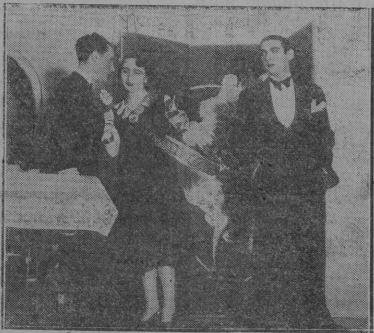
MADRID.—Una escena de la obra "La noche loca," que se estrenó con gran éxito en el teatro Infanta Isabel