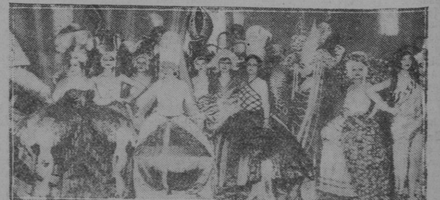
MADRID.—Una escena de la obra "Flores de lujo," que se estrenó en el teatro Reina Victoria