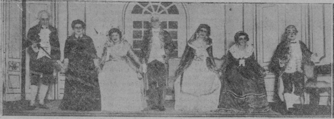
MADRID.—Una escena de "El oficial en marcha," representación en el teatro Español a la memoria de D. Ramón de la Cruz