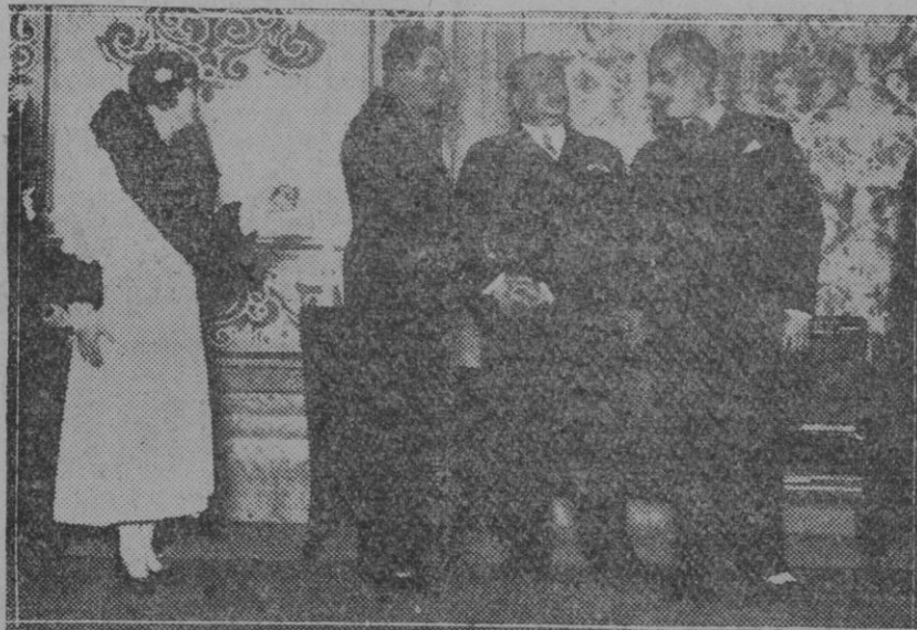
MADRID.—Un momento de la obra "Un programa político," que se estrenó en el teatro Infanta Isabel con gran éxito.