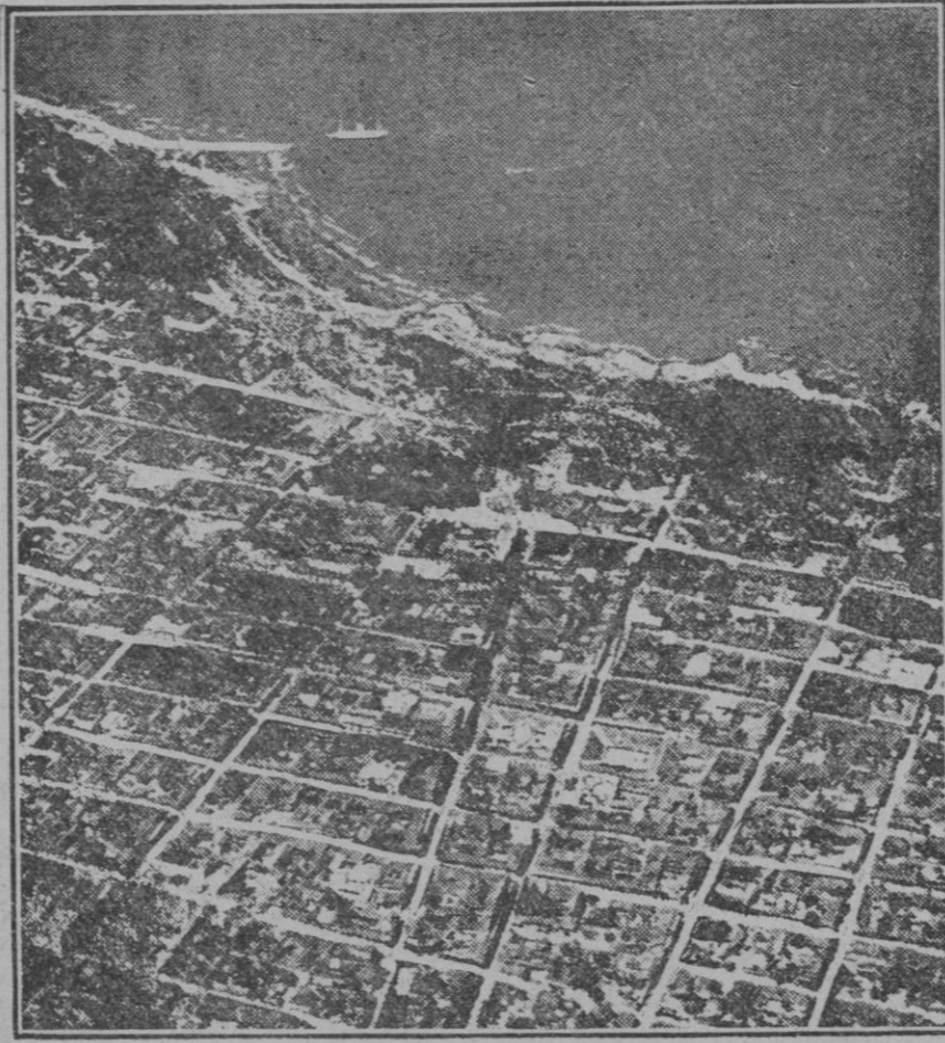
MANAGUA.—Managua capital, de Nicaragua, que ha sido destruida como se sabe por un espantoso terremoto estos días

Es una obra marcada en el plano de Ensanche, es un proyecto cuya realización ha sido intentada en diversas ocasiones por la Corporación Municipal, y cuyo aplazamiento es causa de molestias, que se evitarían realizando cuanto antes lo que al cabo y al fin se habrá de realizar.