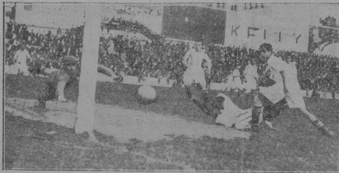
REAL MADRID-REAL SOCIEDAD.—Uno de los goals que consiguieron los madrileños