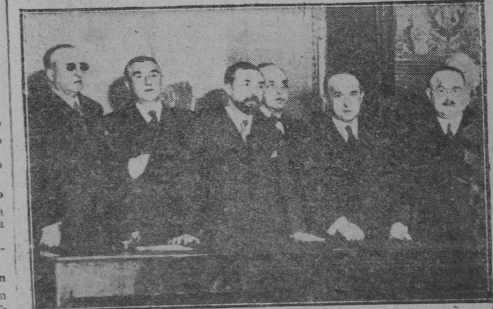
MADRID.—El ministro de Instrucción Pública Sr. Gascón Marín, en la reunión de los rectores de Universidades

Vino el Poder en efecto y vinieron después las elecciones, según es uso en nuestra democracia, y mientras los intelectuales seguían estudiando política y sociología, para su mayor cultura y lustre de su país, fueron ungidos padres de la Patria, los hijos, sobrinos y amigos de los grandes hombres que regían nuestros destinos. No sabían ni entendían de cuestiones políticas y sociales, ni de pronunciar discursos, ni de escribir libros, ni artículos de fondo; y maldita la falta que les hacía, por que es lo que ellos también se di-