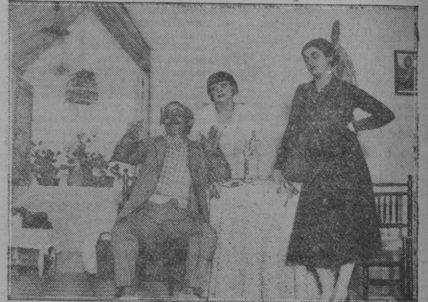
MADRID.—Teatro Español.—Una escena de la obra "Los amores de la Nati," estrenada en dicho teatro con éxito