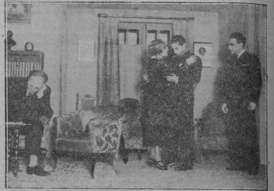
MADRID.—Una escena de la comedia de don Jacinto Benavente "De muy buena familia," que alcanzó gran éxito en el teatro Muñoz Seca