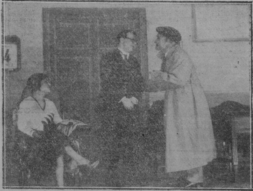
MADRID.—Una escena de la obra "Se necesita un suicida," estrenada en el teatro de la Comedia