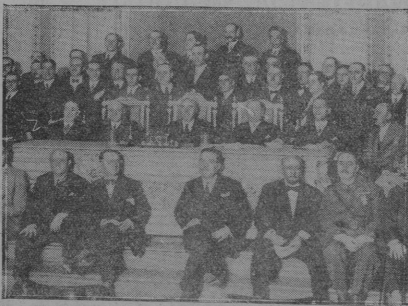
MADRID.—En el Círculo Mercantil.—Apertura de la Asamblea de Tiro Nacional, celebrado en dicho círculo