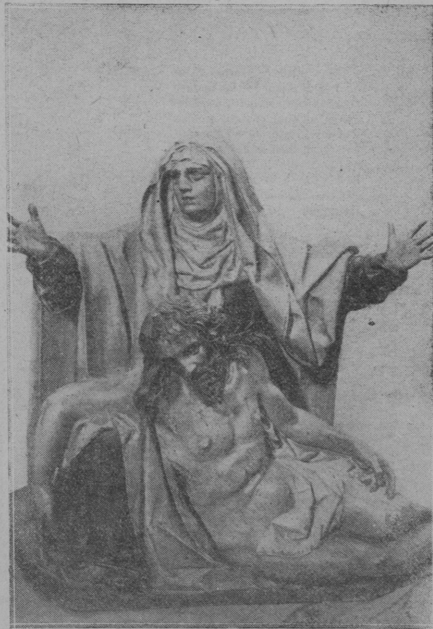
VALLADOLID.—La Quinta Angustia, valiosa talla de Gregorio Fernández

¿Qué mejor ocasión para realizar en esta zona de la ciudad, las mejoras que su debida urbanización reclama?