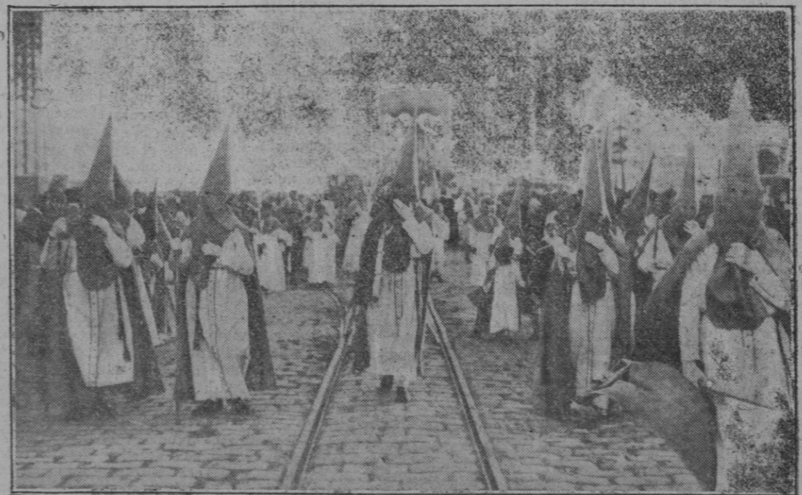
SEVILLA: La procesión del Jueves Santo a su paso por el puente de Triana