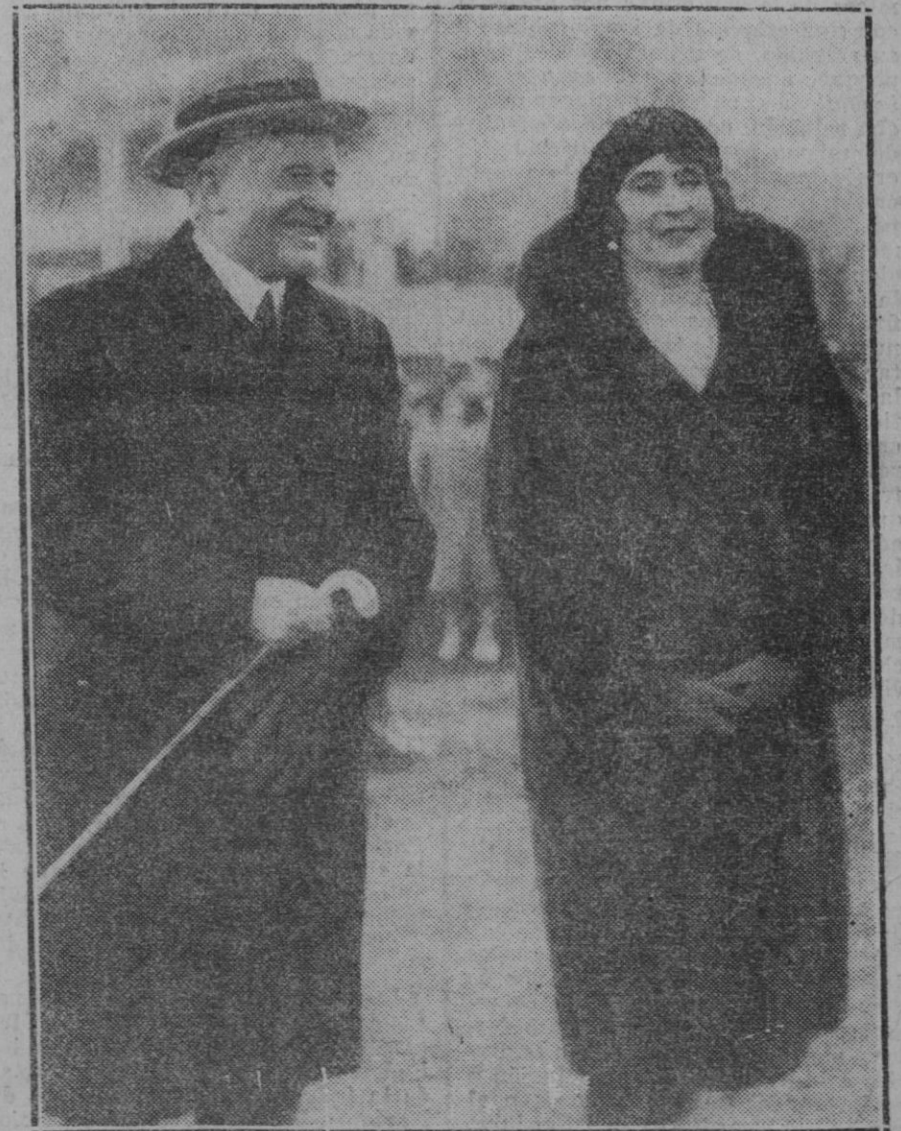
MADRID.— En las carreras de caballos.— Su Majestad la Reina paseando por el Hipódromo de la Castellana en uno de los descansos