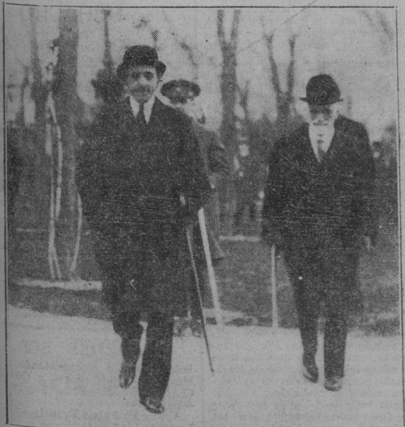
MADRID.— Su Majestad el Rey paseando por el Hipódromo de la Castellana, con otras personalidades durante uno de los descansos

El progreso dinámico, el ensanchamiento de las ciudades donde mudar de barrio equivale casi a cambiar de personalidad, a disfrazarse, en suma, hizo que el elemento bastardo del Carnaval triunfase de momento sobre el sustantivo de uno de esos fulgores excesivos que tienen ciertas luces antes de extinguirse. Quiere decirse ya estaba casi muerto ha ofrecido el Carnaval al Mundo sus fiestas mas suntuosas. El interés de ciertas ciudades, como Niza, y del comercio, pretende en vano cada año inyectarle energía nueva, y la parodia con espectáculos que tienen del Carnaval la apariencia sin tener la entraña. La guerra, con su carnaval trágico de espionajes y sus caretas horribas para defenderse de los gases tóxicos, contribuyó algo a hacerlo antipático. El cinematógrafo, en cuya penumbra hay algo de disfraz y algo de responsabilidad perdida, ha sido otro de los elementos que diluyen en todo el año el espíritu del Carnaval. Y esto, más que su terrible vulgarización y que las monsergas de los moralistas, ha dado al traste de fantasía puedan obrar más corruptoramente sobre la carne que el trepidante "Jazz", y el dulzón alcohol de los tangos argentinos. Quienes se acuerdan sin darse cuenta de los versos de Ruben Darío que dicen: "Se oía el susurro de leves cantares—y se despedían de sus azahares—miles de purezas en los bulevares...", se olvidan cuanto ha perdido el blanco en la cotización real