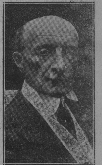
MADRID.—El Alcalde de Paris que ha llegado a esta Corte.

El proyecto de que tratamos, aunque inspirado en excelentes propósitos tiene graves defectos.