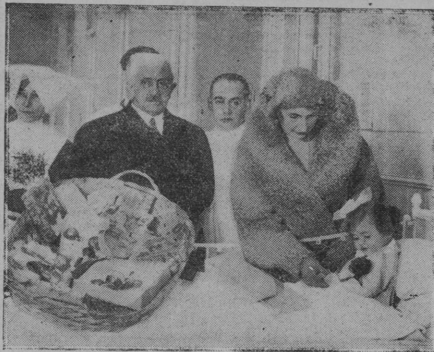
MADRID.—Su Majestad la Reina distribuye juguetes entre los niños enfermos, del Hospital del Niño Jesús

En interés público nos permitimos indicarlo, y por esa misma razón debería el Ayuntamiento atenderla insistiendo una vez más en tan justas como razonadas pretensiones.