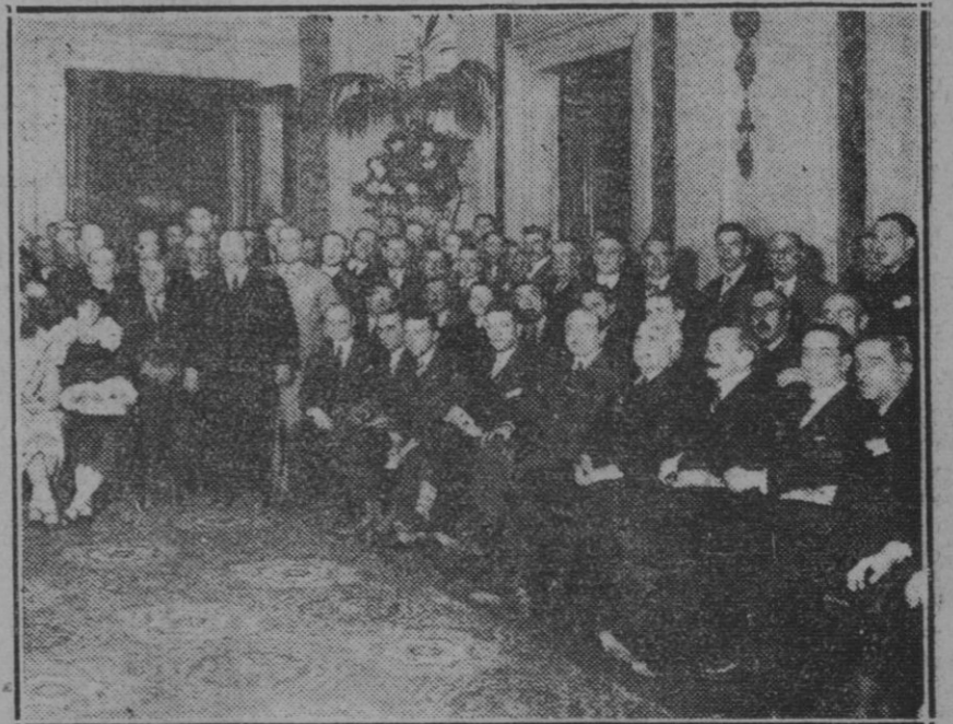
MADRID.—Un grupo de asistentes a la recepción en honor de los delegados del Congreso de la Federación Nacional de Obreros y Empleados Municipales, en el Ayuntamiento

Efectivamente, la estabilización de la lira a un precio notoriamente desproporcionado, por lo excesivo, produjo en Italia serias perturbaciones, comenzando por varias huelgas, tan justas, que Rosoni y los demás líderes del sindicalismo fascista no sólo no se