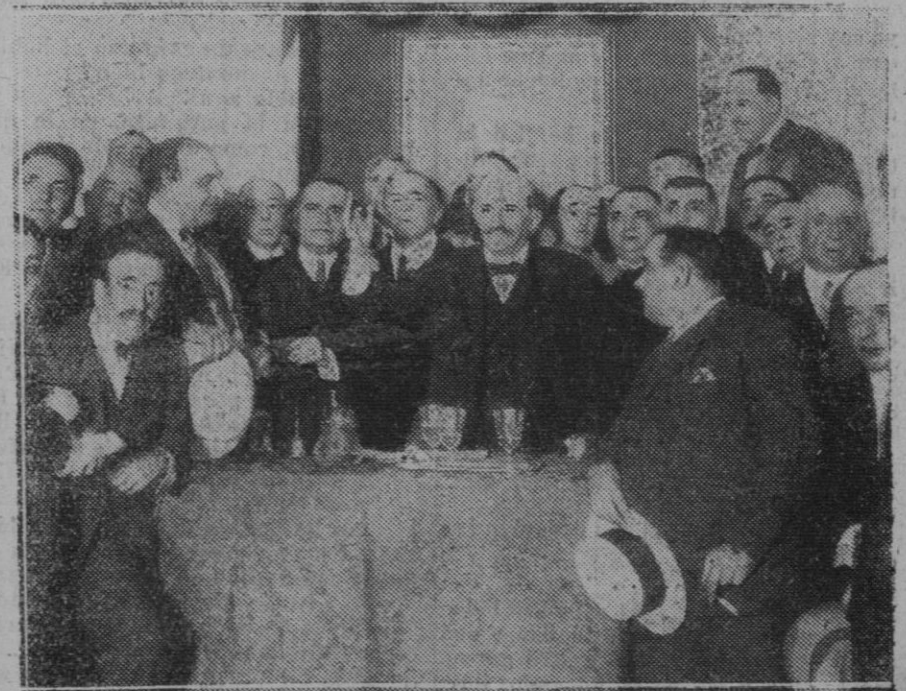
MADRID. — El Conde de Romanones pronunciando un discurso durante el acto en el Círculo Liberal.

Pero la actual crisis no podía conducir más que a dos soluciones: a que el Parlamento derribase al Ministerio Sidky Bajá el mismo día en que se presentara en el salón de sesiones, con lo cual era inevitable la vuelta de Nahas al Poder, o la repetición de la dictadura de 1928, con todas sus consecuencias.