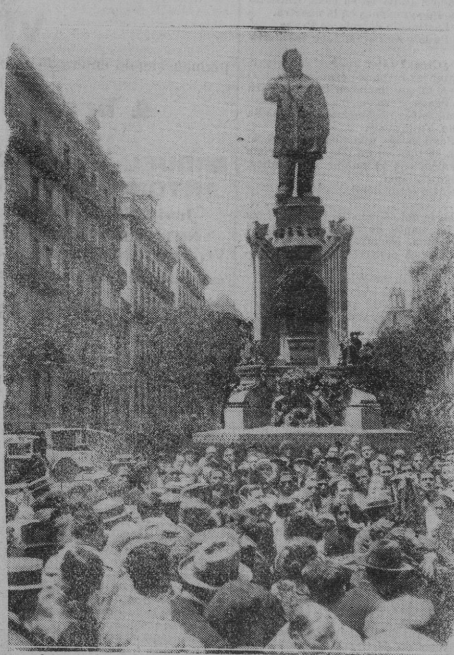
BARCELONA. — El desfile de la Exposición de Barcelona es muy nutritivo puesto que han ido representaciones de todas las regiones españolas. En este desfile han participado elementos asturianos, uno de cuyos primeros actos ha sido depositar una corona de flores al pie del monumento dedicado a Clavé

En este plan, en el cual huelga decir que habremos de alentarle muy decididamente, no es posible olvidar la mejora que pretendemos pues es una obra que de consuno la reclaman la comodidad del vecindario y el embellecimiento de Palma, pues el hecho de que estén sin pavimentar en forma adecuada los paseos centrales de unas avenidas cuyas vías para el tránsito rodado están asfaltadas da la impresión de que se ha procedido sin orden ni concierto a la urbanización de nuestra ciudad.