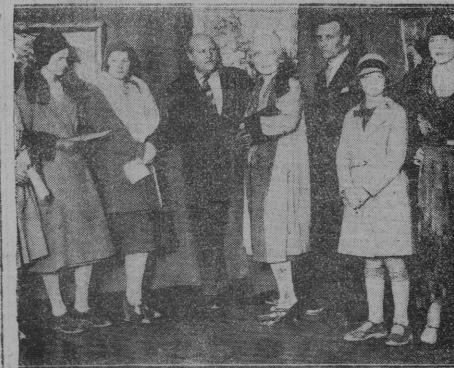
MADRID.—En el Museo de Arte Moderno.—Inauguración de la Exposición de Pintura del notable artista norteamericano mister Louterback.