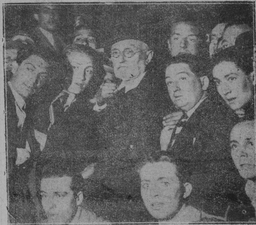
MADRID.—El señor Unamuno en la estación del Norte a su llegada a esta Corte.