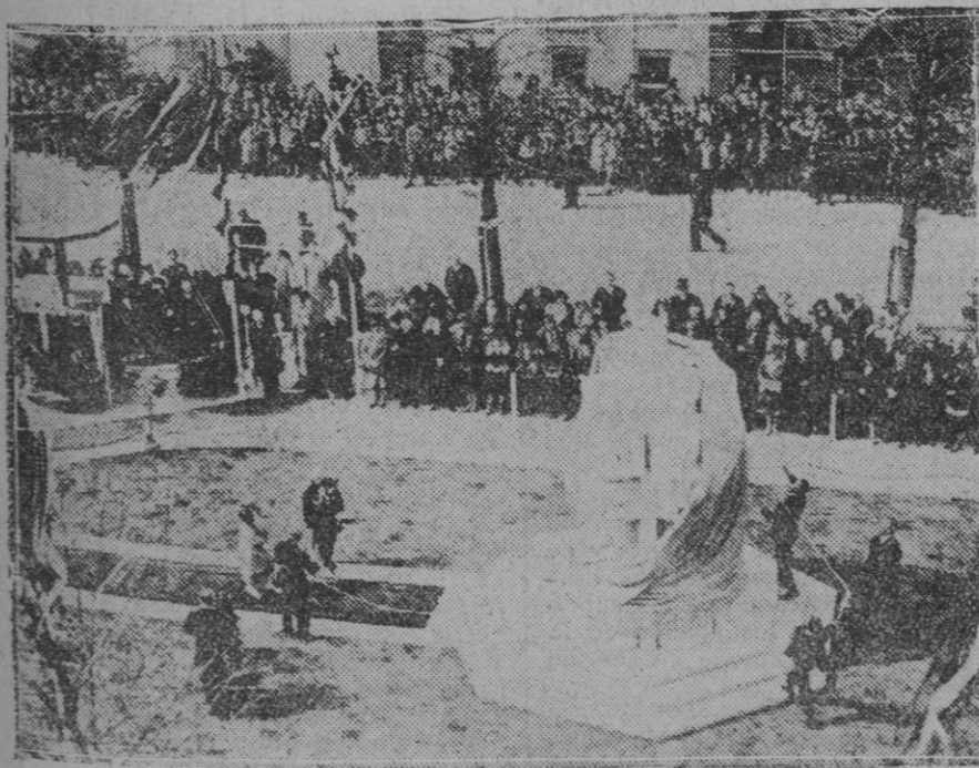
EXTRANJERO.—Momento de ser inaugurado en La Haya el monumento a la Reina Juliana, que hace varios siglos reinó en los Países Bajos. Al acto asistieron la Reina Guillermina, la Reina Madre, el Príncipe consorte y la Princesa heredera, que lleva el mismo nombre de la Soberana, cuyo monumento perpetúa la gloria de su reinado.