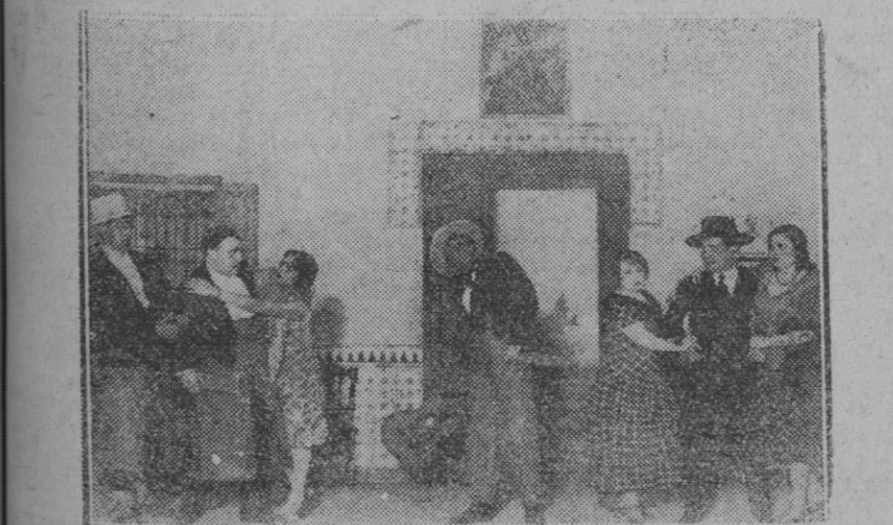
MADRID.—Una escena de "Córdoba la Sultana", estrenada recientemente en el teatro Pavón por la compañía de Carlos Martínez Baena

Algunos habitantes que se opusieron a que se llevaran a cabo estas matanzas fueron maltratados y deportados a las estepas.