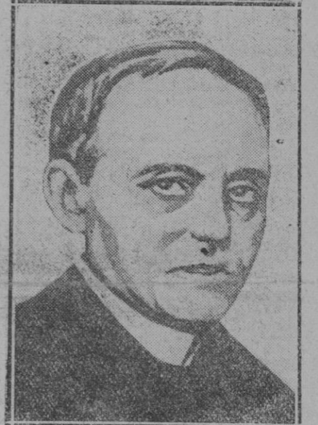
Tardieu, Jefe del Gobierno francés, una de las personalidades más destacadas en la Segunda conferencia de la Haya