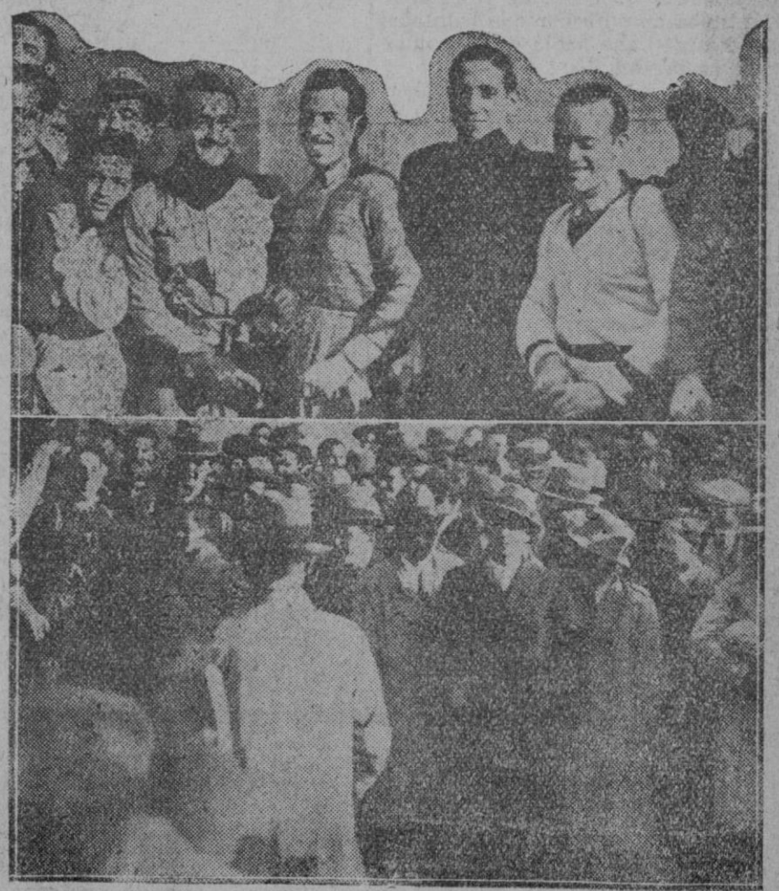
MADRID.—(arriba): Los cinco animosos que harán catorce jornadas a pie, por carretera para visitar la Exposición de Sevilla. (abajo): Los compañeros de los excursionistas en el momento de la despedida al emprender la marcha