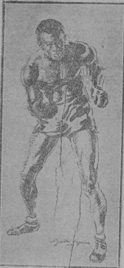
Black-Bell, cubano, negro, probable campeón del mundo, peso mosca al vencer al francés Henat.