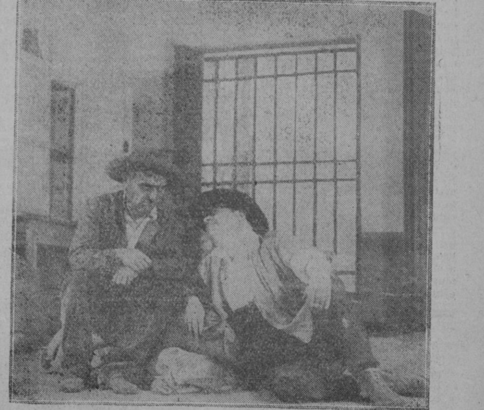
MADRID.—Una escena del juguete cómico de Muñoz Seca y Pérez Fernández "Los ilustres gañanes" que se estrenó en el teatro de la Comedia.

Y les injerta glándulas de mono. Colombo.—El célebre doctor Voronoff, que se encuentra en esta ciudad desde hace algún tiempo, dedicado a hacer experiencias sobre su sistema de rejuvenecimiento por medio de injertos de glándulas de mono, ha declarado a un periodista que en la actualidad todos sus esfuerzos van dirigidos a realizar los injertos en los niños pequeños, con el fin de conseguir ejemplares humanos de gran inteligencia. "Desde luego, no pretendo hacer genios—continúa diciendo el doctor Voronoff modestamente—. Unicamente puedo asegurar que con mi procedimiento o realizado en un niño de pocos meses, se consigue que cualquier poder físico o mental inherente en el niño alcance un desenvolvimiento pleno y vigoroso... Luego el célebre médico habló del conservadurismo de los ingleses en determinados aspectos de la vida. "En cuanto es preciso hablar de la cuestión sexual, hasta la ciencia inglesa se hace conservadora. Mis experimentos sobre los injertos de las glándulas de mono son discutidos de una manera injusta en Inglaterra. El resultado ha sido que mi trabajo a favor de la humanidad que sufre es oscurecido y vilipendiado. Algunas veces me veo obligado a comparar a los cirujanos ingleses con pudibundas solteronas..."