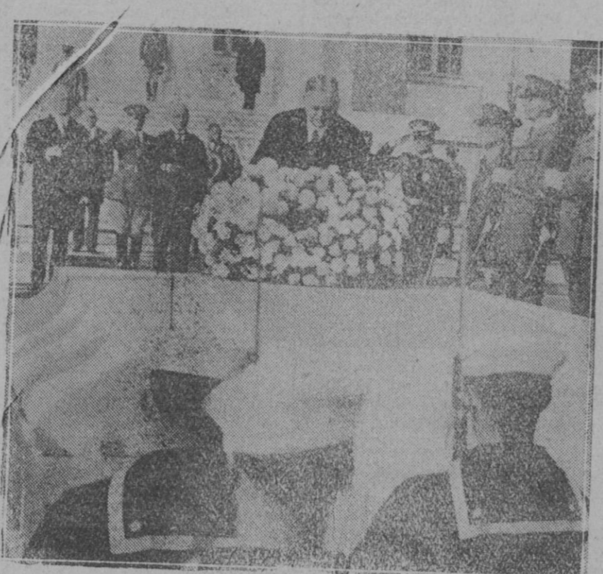
HONRANDO A LOS HEROES.—El Presidente estadounidense Hadsit Hoover, colocando una corona de flores en la tumba del soldado desconocido durante la celebración del aniversario del armisticio en Washington.